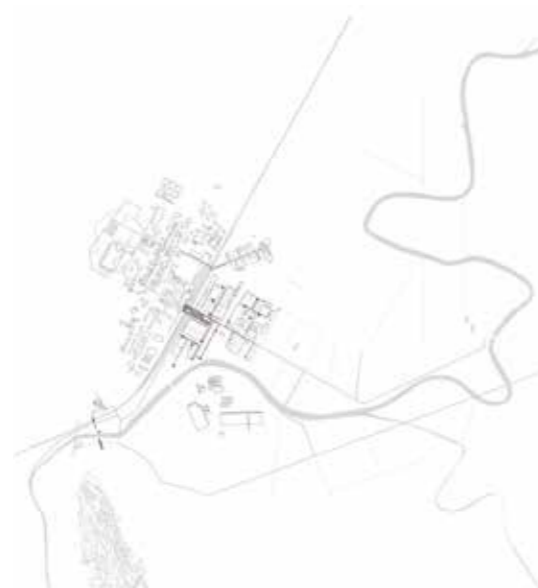
Sistema delle connessioni principali.