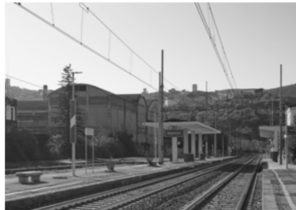
La stazione di Narni.