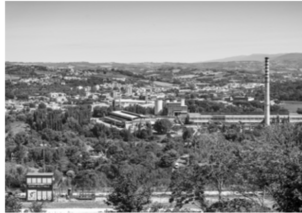
Narni Scalo vista dal centro storico.

Il progetto interpreta questo obiettivo proponendo un edificio a piastra, che si accosta alla stazione e ne diventa un'estensione scavalcando i binari. L'edificio costituisce a tutti gli effetti il nuovo trait d'union tra i due ambiti urbani. La piastra, incisa da grandi vuoti, genera relazioni inedite con il contesto: orizzontali, nel modo in cui collega le industrie con le residenze e gli spazi pubblici intorno alla stazione; verticali, per come mette in tensione la quota aerea, dominata dai silos e dalle ciminiere, con il suolo disegnato dall'infrastruttura dai binari. A partire dal recupero delle rotaie dismesse, si immagina un parco urbano lineare che si sviluppa dalla stazione fino al Ponte di Augusto, riconfigurando, ove possibile, le aree residuali, gli spazi di margine e gli incolti, attraverso un'azione progettuale a "bassa definizione", caratterizzata da pochi segni e da un alto grado di adattabilità alle trasformazioni future. Sempre dalla stazione, parte un circuito formato da una rete di camminamenti