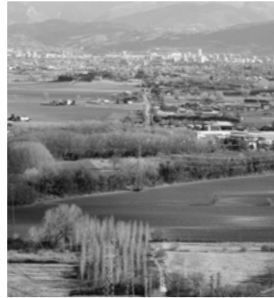
Il tracciato della via Flaminia verso Terni.