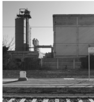
Dettaglio del polo industriale di Narni Scalo.