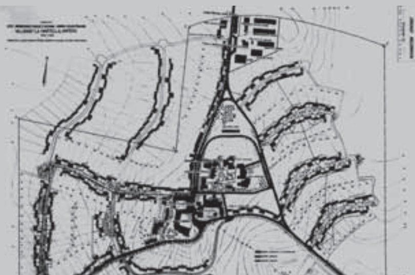
Fig. 2 - Villaggio La Martella. Planimetria generale.