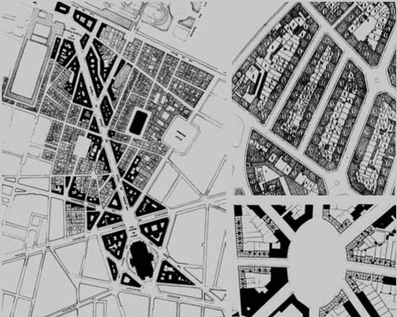
Fig. 3 - a. Aymonino C., Edilizia vecchia e nuova del tessuto di Parigi ; b. Caniggia G., Studio dei condizionamenti radiali negli isolati . a. Aymonino C., Old and new building of the fabric of Paris ; b. Caniggia G., Study of radial conditioning within blocks .

storico di Bergamo (fig. 1). Giovannoni, in un certo senso, aveva anticipato quella preoccupazione per il destino dei centri storici che sarà oggetto di dibattito dagli anni '60 e che, in un certo senso sarà più innovativa di quella proposta da Astengo per il piano di Gubbio, che distinguendo la parte storica dal resto della città, limitava al mantenimento dello status quo l'azione per quell'edilizia "ambientata" "non di valore".