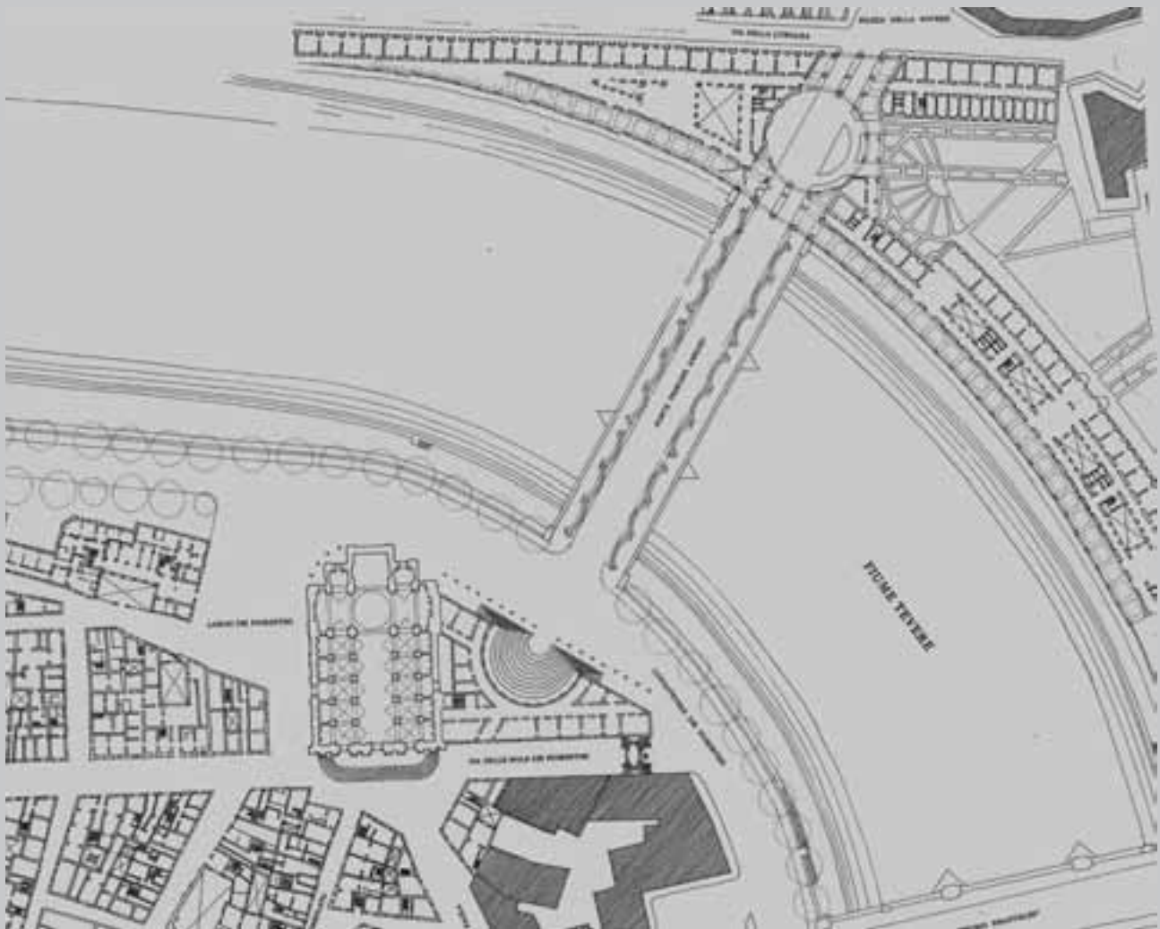
Fig. 5 - Caniggia e altri. Concorso di progettazione per "I buchi di Roma". Caniggia and Alias. Architectural competition: "I buchi di Roma".

necessariamente alla luce delle attuali conoscenze geofisiche del luogo. Com'era e dov'era che nel disegno e nel rilievo si rivela trascrizione grafica della città reale e che nel suo modo di crescere conserva codici e regole che ne hanno determinato la formazione e guidato la trasformazione. Da cogliere nella differenza dello spessore di un muro o nel diverso angolo di una sostruzione muraria, quando ciò alluda e suggerisca una possibile e particolare fase di sviluppo del tipo e del tessuto edilizio: "Solo una piena comprensione – ci dice Collotti – dei motivi e dei risultati delle scelte passate può consentire oggi, in un contesto storico in cui le distruzioni catastrofiche sono in continuo aumento e i fattori di complessità dei processi di ricostruzione crescono esponenzialmente, di inserire criticamente le scelte contemporanee in una traiettoria complessiva che fondi sulla comprensione del passato il progetto del futuro".