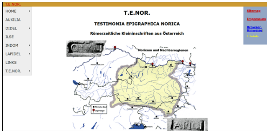
Fig. 4: screenshot di T.E.Nor.