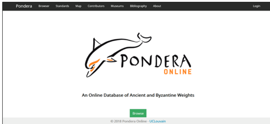
Fig. 5: screenshot di Pondera Online.