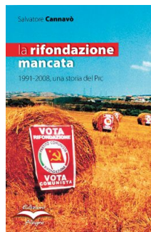
La rifondazione mancata