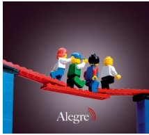
I Padrini del Ponte