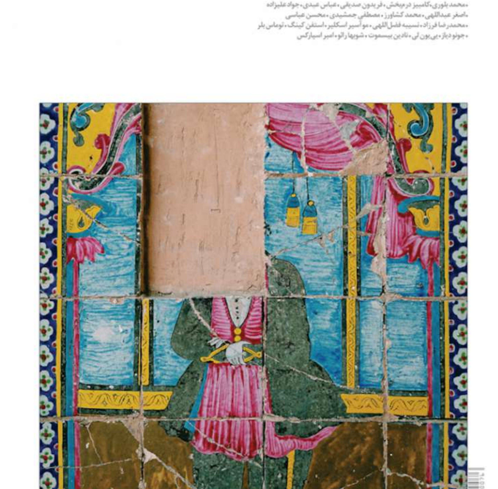
Copertina dell'ultimo numero della rivista Dastan.