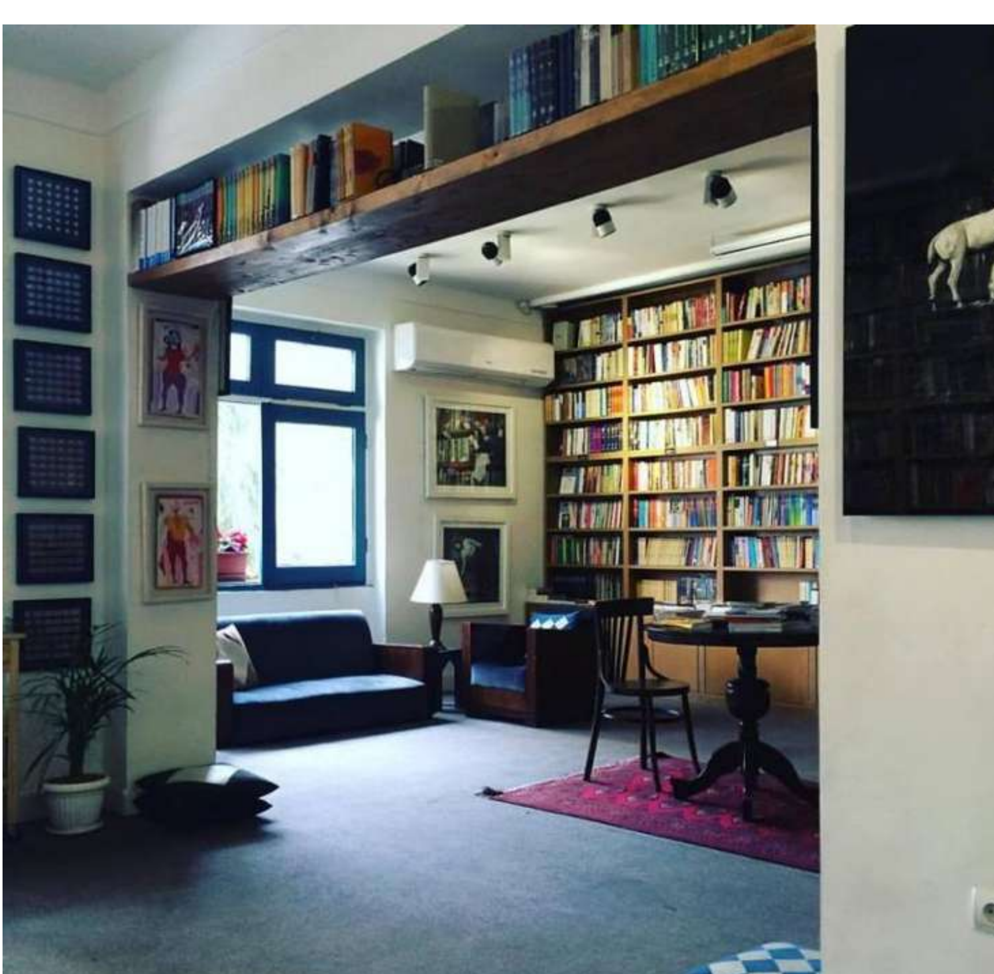
Una libreria del centro di Tehran.

Una decade che rimbalza nell'ultima fatica letteraria di Mahsa Mohebbi, Noi resisteremo (2016), dove il tentativo di metterne in luce la ricaduta sul presente è molto più esplicito. La protagonista è un'avvenente segretaria di trent'anni, una donna oggetto che deve compiacere il capo e soddisfare le aspettative della famiglia, quasi un cliché. Ma nell'odierna Tehran i personaggi più stereotipati possono nascondere un passato inaspettato, così man mano che la narrazione procede scopriamo che alle spalle di questa ragazza che sembra concentrata solo sui soldi e sul trucco c'è un'intricata vicenda familiare che affonda le radici proprio nei tumulti della rivoluzione e nel destino in cui scivolarono tanti militanti di sinistra.