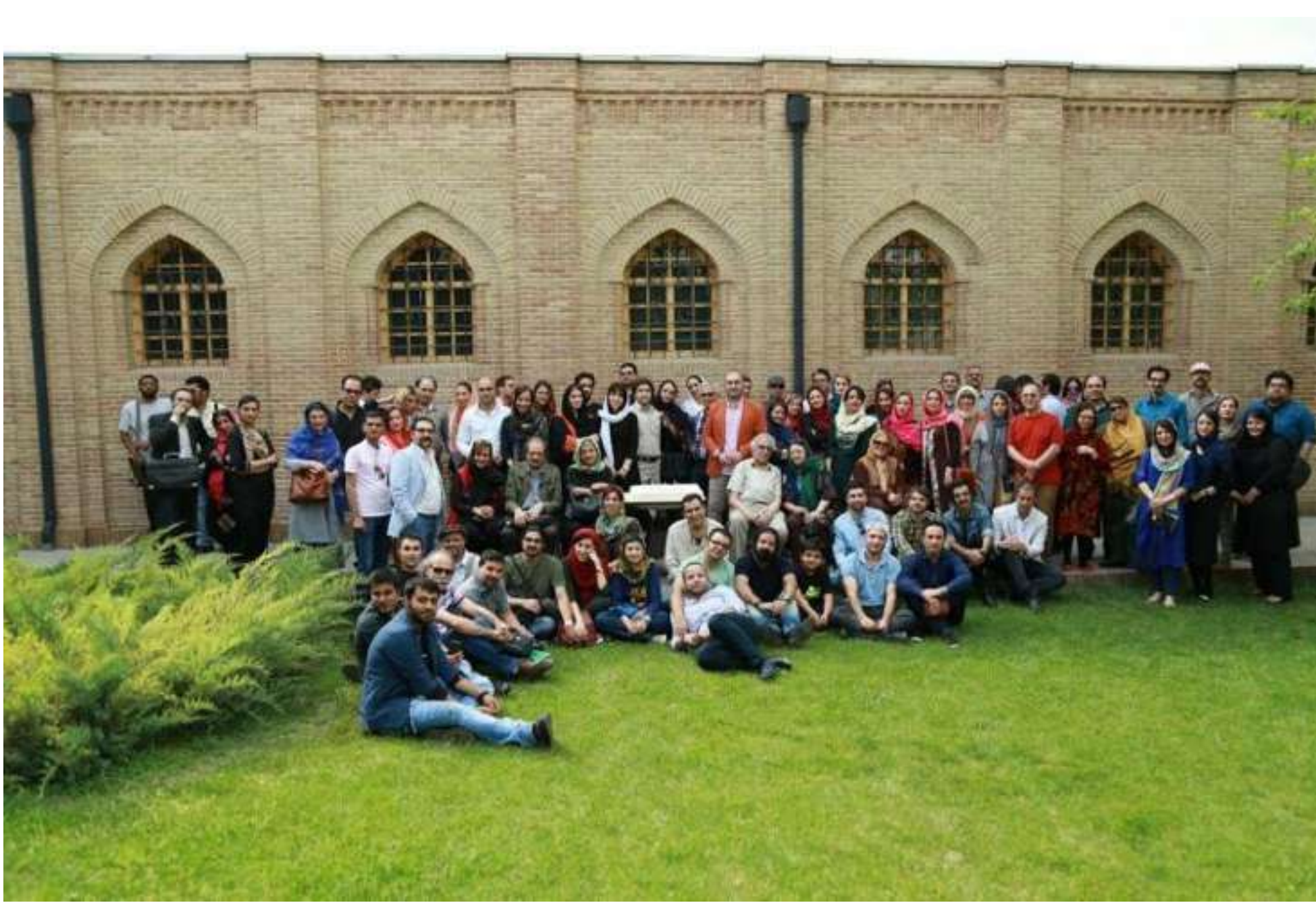
Una foto di gruppo (dove compare qualche scrittore citato) scattata al museo della prigione Qasr nel 2014 in occasione del quinto anniversario del sito "Doshanbeh".

Nel 2015 la rivista si è fatta promotrice di un premio, in collaborazione col comune di Tehran. Scrittori professionisti e principianti sono stati invitati a inviare alla redazione un racconto ambientato nella capitale. Le adesioni sono state numerosissime, e hanno coinvolto non solo l'area metropolitana, ma anche le province: nella prima edizione sono pervenuti 1400 racconti e il dato è cresciuto in quelle successive.