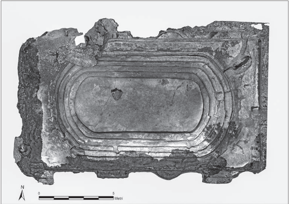
Fig. 3 – Ortofoto della vasca in località Ficoncella (rielab. S. De Togni, A. Melega).