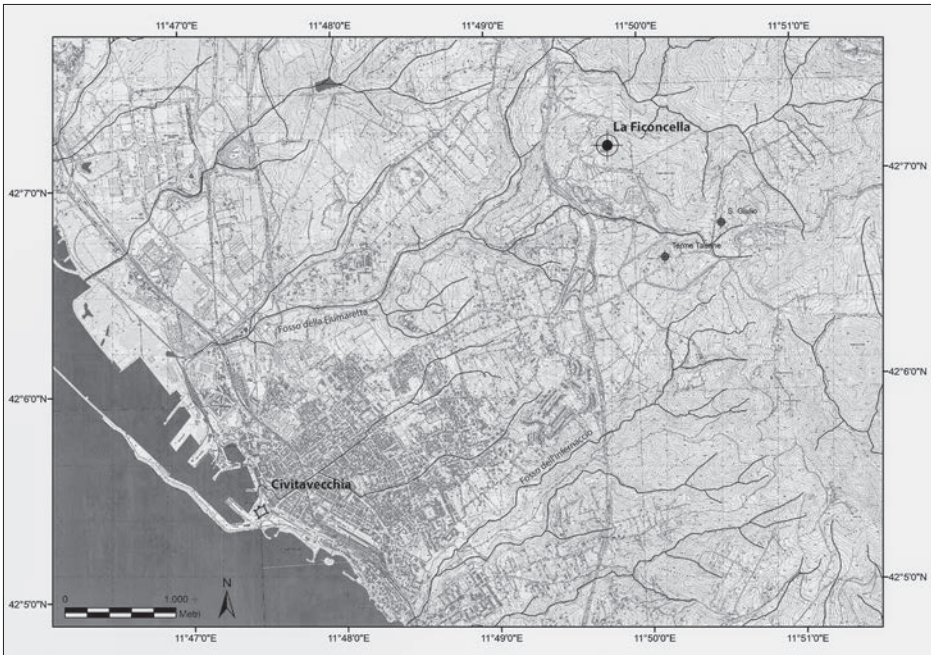
Fig. 1 – Pianta del territorio di Civitavecchia con localizzazione del sito della Ficoncella (rielab. S. De Togni).