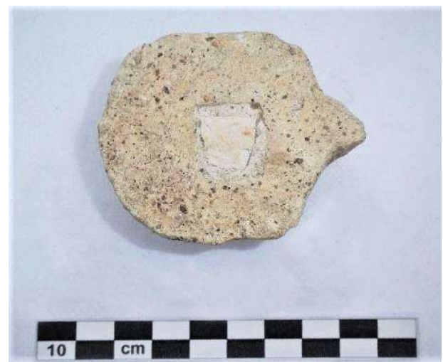
Fig. 10. N. Cat. 10. Esagonetta fittile. Foto dell'Autore.