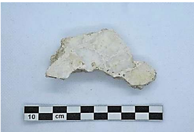
Fig. 2. N. Cat. 2. Frammento pertinente al mosaico 169.