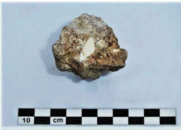
Fig. 6. N. Cat. 6. Frammento di cementizio con inserto litico.