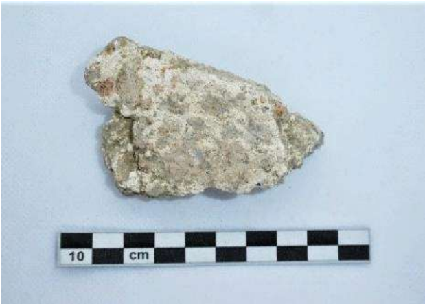
Fig. 5. N. Cat. 5. Frammento di cementizio.