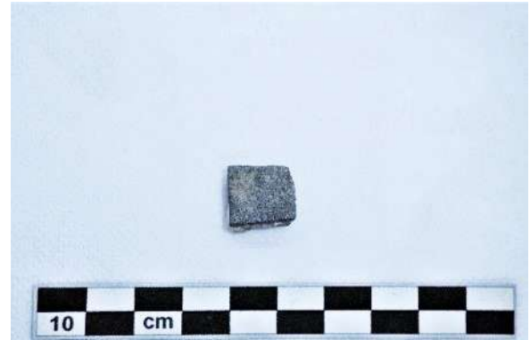
Fig. 9. N. Cat. 9. Tessera litica.