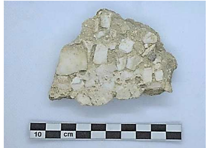
Fig. 3. N. Cat. 3. Frammento pertinente al mosaico 153.