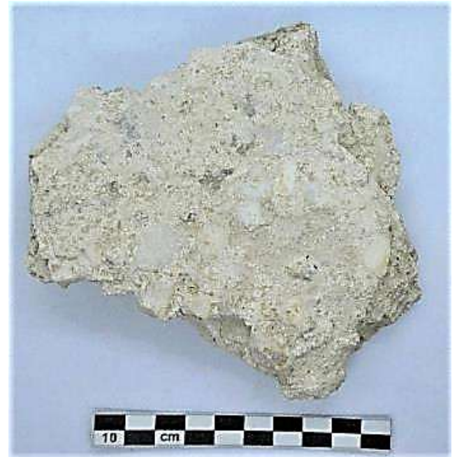
Fig. 4. N. Cat. 4. Frammento pertinente al mosaico 87.