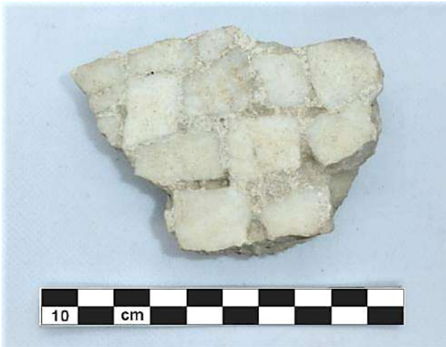
Fig. 1. N. Cat. 1. Frammento pertinente al mosaico 169.