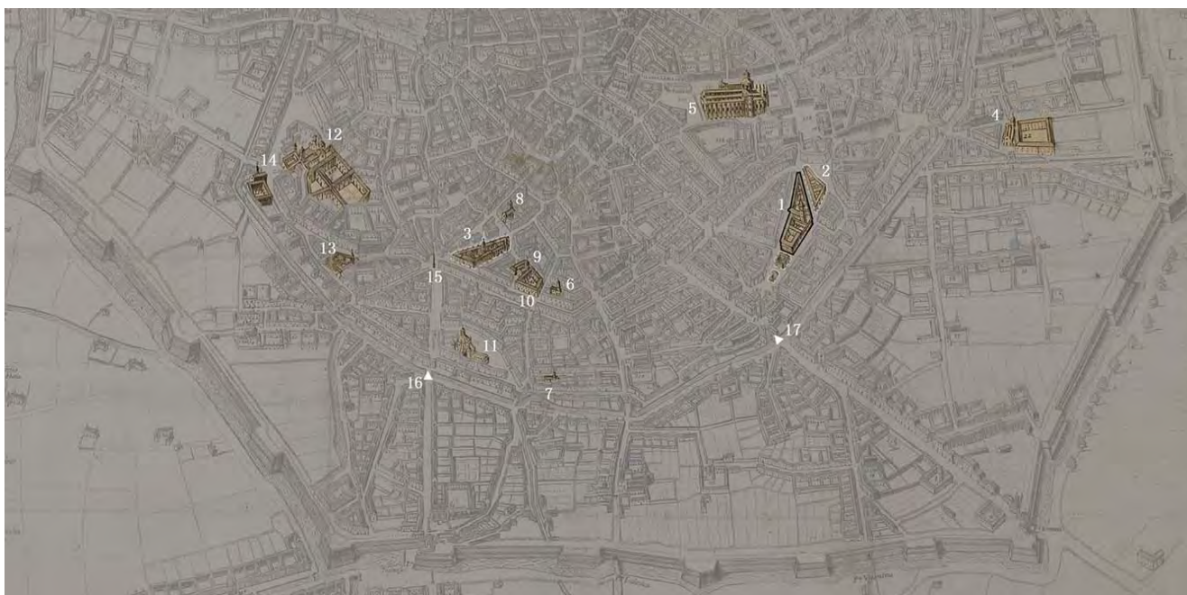
2: Marc'Antonio Barateri, La Gran città di Milano, veduta a volo d'uccello , 1699, incisa da Gio. Paolo Bianchi. Stralcio rielaborato in cui sono evidenziati: l'isolato di Sant'Antonio acquisito dai Teatini (1), l'area di possibile espansione per la chiesa di S. Antonio (2), l'area per la nuova sede del Carrobbio (3), chiesa di San Pietro dei Monaci si San Benedetto (4), il Duomo (5), chiesa di S. Fermo (6), chiesa di S. Pietro in Campo Lodigiano (7), chiesa di S. Giorgio in Palazzo (8), S. Alessandro, chiesa dei padri Barnabiti (9), chiesa di S. Maria delle Monache di S. Benedetto (10), collegiata di S. Lorenzo (11), convento di S. Ambrogio Maggiore dei padri Cistercensi (12), chiesa delle Monache di S. Bernardino (13), chiesa di S. Michele delle Monache Cistercensi (14), crocetta del Carrobbio (15), Porta Ticinese (16), Porta Romana (17).