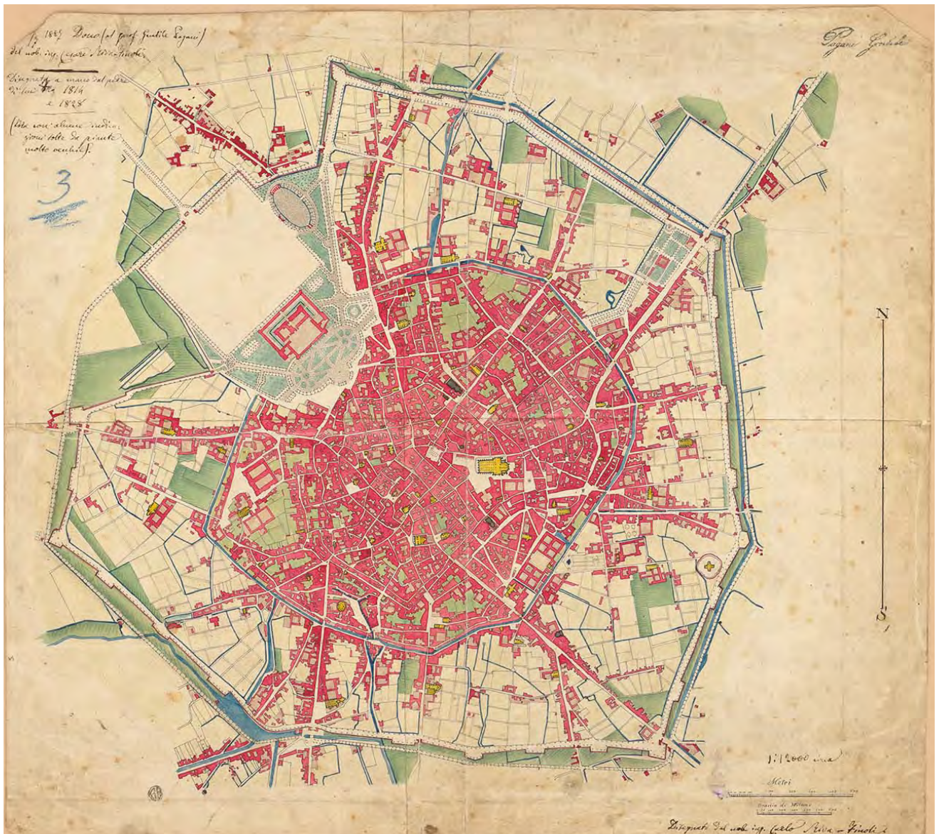
1: Carlo Riva Finoli, Pianta topografica di Milano (1814).

rispetto ai vicari imperiali, ma soprattutto a configurare l'immagine urbana della città [Guidoni, Marino 1982, 500-513].