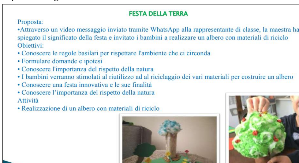
Figura 7 - Slide estratta dalla presentazione di un progetto di Scuola dell'infanzia

Dieci progetti riportano accuratamente gli obiettivi educativi delle diverse attività proposte; si riporta un esempio nella figura 7.