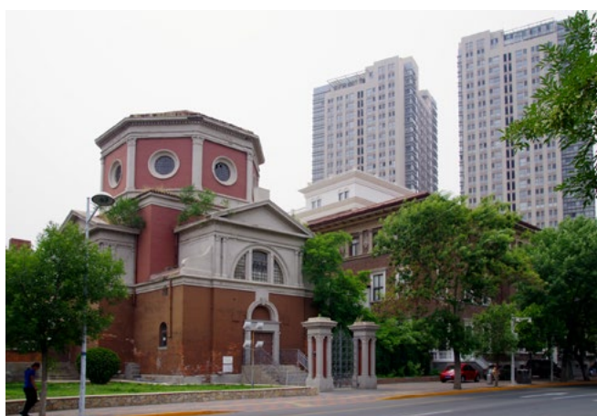
Veduta della ex chiesa del Sacro Cuore e dell'ex ospedale civile da Jian'guo Lu, già corso Vittorio Emanuele II, 16 giugno 2018.

Le pratiche progettuali messe in campo negli ultimi dieci anni per il recupero dell'area sud dell'ex Concessione Italiana, la più commerciale e turistica intorno a Ziyou Lu, sono volte a ricostruire uno stato certamente mai esistito nella perfezione materica e costruttiva in cui lo troviamo oggi, finalizzate alla creazione di un luogo unico e «memorabile» nel panorama cinese. Occorre tenere presente che quella italiana è solo una delle otto concessioni cedute dall'impero cinese, a partire dal 1902, a Gran Bretagna, Russia, Giappone, Germania, Francia, Belgio e Impero Austro-Ungarico: ma, sebbene fosse la più piccola per dimensioni dopo quella belga 6 , è l'unica ad avere mantenuto sino ad oggi le sue caratteristiche morfologiche, urbane ed architettoniche 7 . Si tratta di un quartiere a bassa densità, sopravvissuto alla sua cessione alla Cina come conseguenza del Trattato di Parigi (1947), e alle logiche commerciali locali che avrebbero potuto decretarne la distruzione. Le ragioni del suo mantenimento non sono state ancora rintracciate nemmeno da Pierre Singaravélou nel suo magistrale studio sulla città di Tianjin 8 : è lecito supporre che siano da individuare nella solidità, nel buono stato di conservazione degli edifici e nella speciale e compatta identità architettonica, che ha reso questo quartiere una singolarità rispetto al panorama edilizio circostante, un caso di brand architecture identificativo di un primordiale "made in Italy" capace di suscitare interesse.