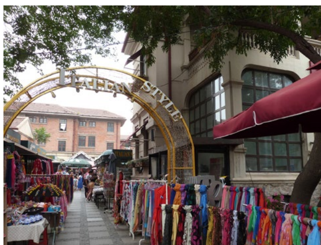
Le zone turistiche e commerciali nella parte sud della ex Concessione Italiana di Tianjin.

efficiente, armonioso e piacevole» è solo uno dei numerosi slogan. I cartelloni pubblicitari presenti sul sito a settembre 2017 davano risalto alla vicinanza con le infrastrutture esistenti: il complesso è infatti localizzato a soli 600 metri dalla stazione ferroviaria di Tianjin (dieci minuti a piedi) e in adiacenza alla stazione Jianguodao della metropolitana,