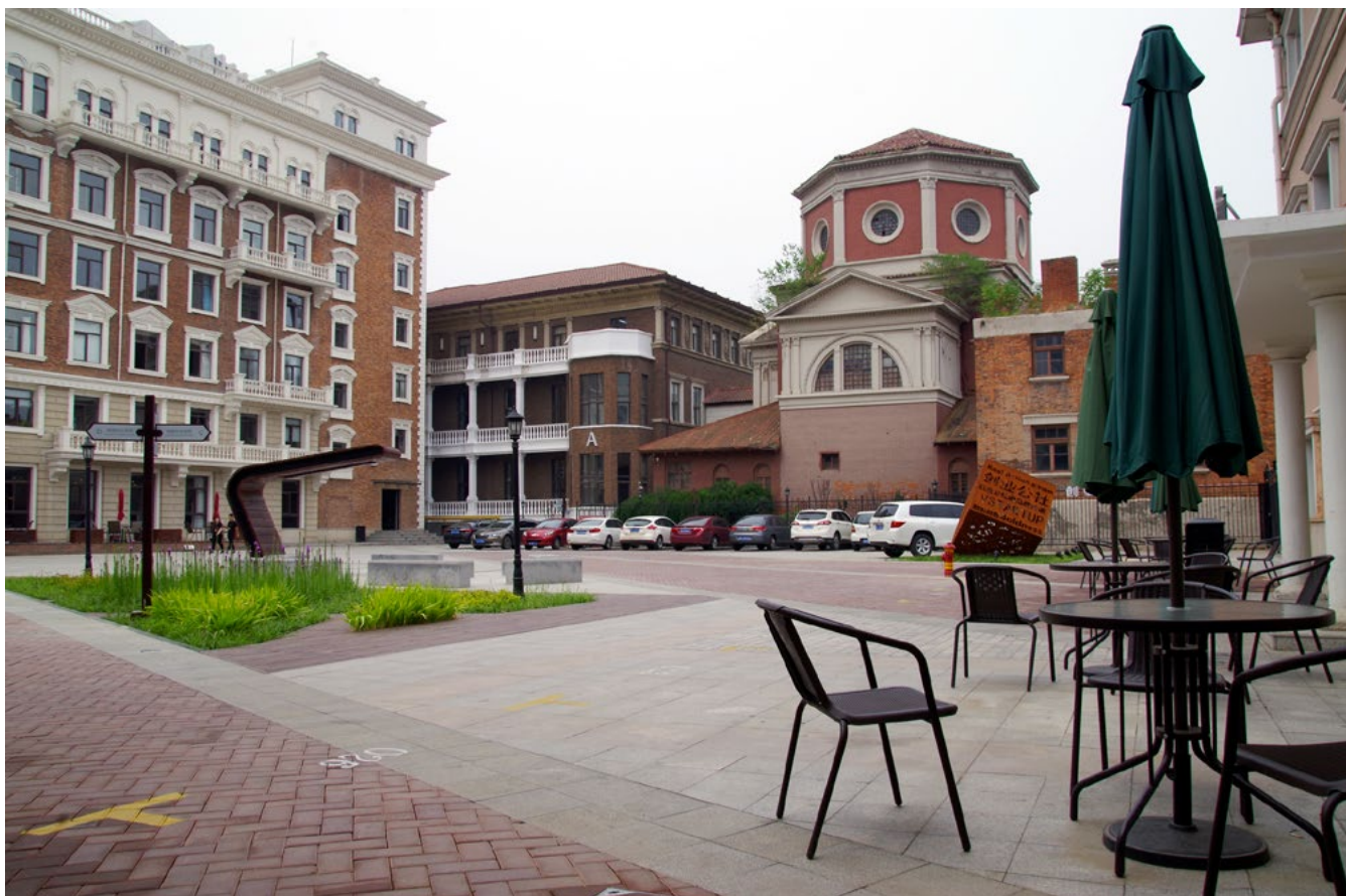
Veduta degli edifici del complesso VSTARTUP dalla corte: si notano l'ex chiesa del Sacro Cuore, non ancora recuperata e rifunzionalizzata e, contraddistinto con la lettera A, il retro dell'ex ospedale civile, 16 giugno 2018.

Un luogo da preservare, dunque, ed enfatizzare al di là della produzione massiva di superfici per fini speculativi 9 . Il recente processo di recupero ha voluto riportare, con obiettivi prevalentemente commerciali, questi luoghi ad un aspetto riconducibile grossomodo al 1943 10 : un chiaro processo di “disneyficazione” pianificato ad hoc puntando su identità e brand intrinseche nel luogo.