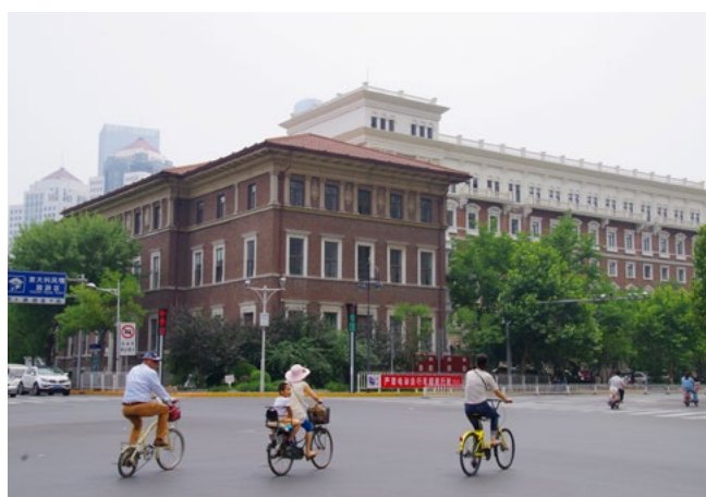
Veduta dell'ex ospedale civile da Jian'guo Lu, già corso Vittorio Emanuele II, 16 giugno 2018 (fotografia di Alberto Bologna).