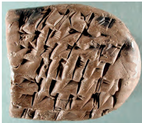
Figura 6. – PF 0342.