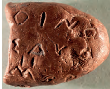
Figura 4. – Fort. 1171 (fotografia cortesia del PFA Project diretto dal prof. M.W. Stolper).

Il contenuto dell'iscrizione e le impronte dei sigilli fanno di questa tavoletta un documento perfettamente coerente con il resto del materiale dell'archivio. Si tratta, infatti, di una vera e propria registrazione di una transazione economica – la consegna di una certa quantità di vino – che è documentata anche in alcune tavolette in elamico. Le due impronte di sigilli, secondo l'ipotesi più diffusa, indicherebbero il fornitore del vino e il destinatario 20 .