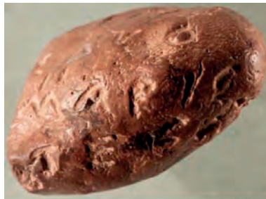
Figura 5. – Fort. 1171.