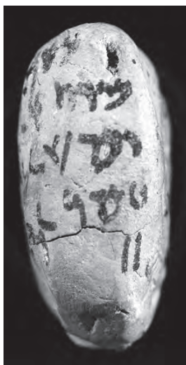
Figura 7. – PFAT 047.

Il simbolo aggiunto nella tavoletta, quindi, può essere interpretato come greco o aramaico. È ipotizzabile, peraltro, che esso potesse essere riconosciuto anche da un elamita o da un babilonese in base alla forte somiglianza formale con il simbolo corrispondente nei rispettivi sistemi di numerali, e forse, anche se meno immediatamente, da un persiano. In ogni caso lo scopo del <II> sulla tavoletta deve essere stato quello di chiarire il δύο in lettere greche. Potremmo paragonare la funzione di questo segno al gesto che compiamo con le dita della mano per indicare il numero 2, spesso accompagnandolo alla pronuncia della parola, quando il nostro interlocutore non è in grado di capire il significato del termine.