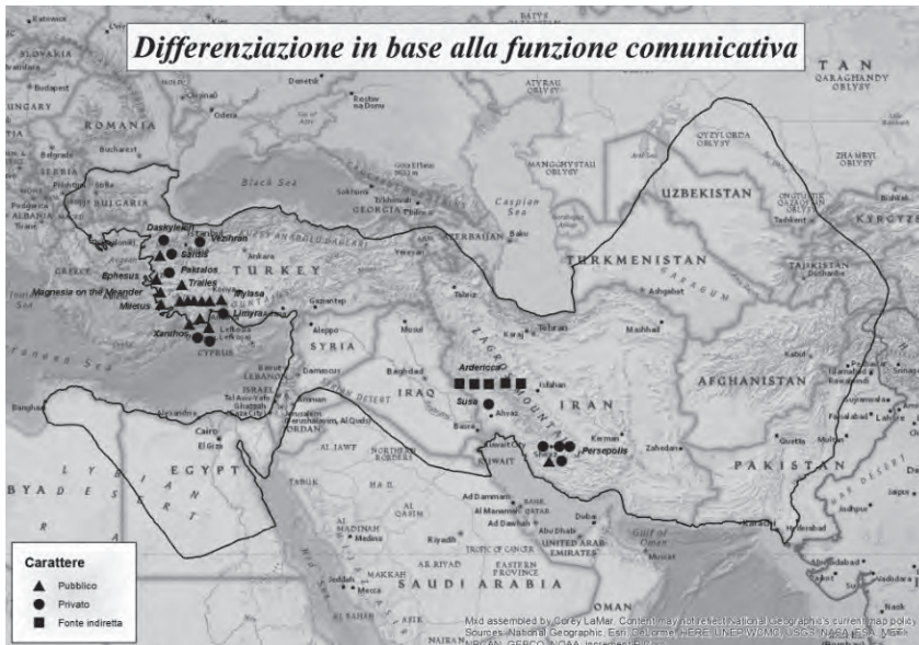
Figura 1. – Le epigrafi greche nell'impero achemenide: funzione comunicativa.

Per quanto riguarda la fase achemenide (550-330 a.C.), la documentazione epigrafica in lingua greca, soprattutto nelle regioni centrali dell'impero, è decisamente scarsa sia da un punto di vista qualitativo sia quantitativo. Dalle carte riprodotte nelle Figure 1 e 2 , realizzate utilizzando la tecnologia del GIS ( Geographic Information System ), emerge un quadro abbastanza chiaro 6 .