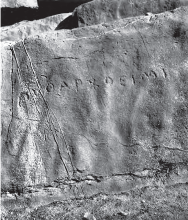
Figura 3. – Iscrizione di Pytharchos (da Pugliese Carratelli 1966, fig. 2).

fenomeni di interferenza con le lingue locali 10 . Il graffito ΠΥΘΑΡΧΟ ΕΙΜΙ (Fig. 3) è da interpretarsi come un Πυθάρχου εἰμί, in quanto in ionico-attico <E> ed <O> sono usate comunemente per rappresentare [e:] ed [o:] sino a dopo il IV secolo a.C., quando verranno definitivamente sostituite rispettivamente dai digrammi <EI> ed <OU> che, però, anche se in modo non sistematico, cominciano ad apparire già nel V secolo a.C. Poiché tra gli usi precoci del digramma <EI> è compreso quello nella parola εἰμί, la sua presenza nell'epigrafe in esame non risulta problematica.