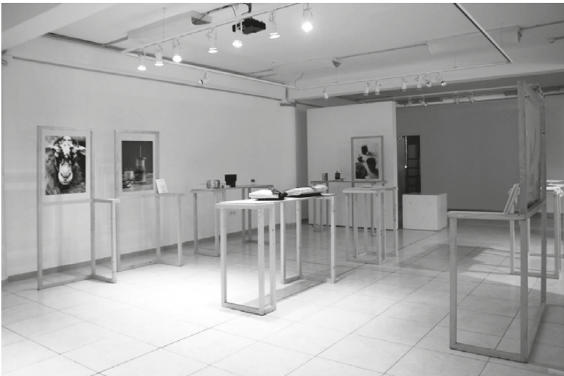
Teaching activity at POLIS University, Design Exhibition at M.A.D. Gallery of POLIS University.