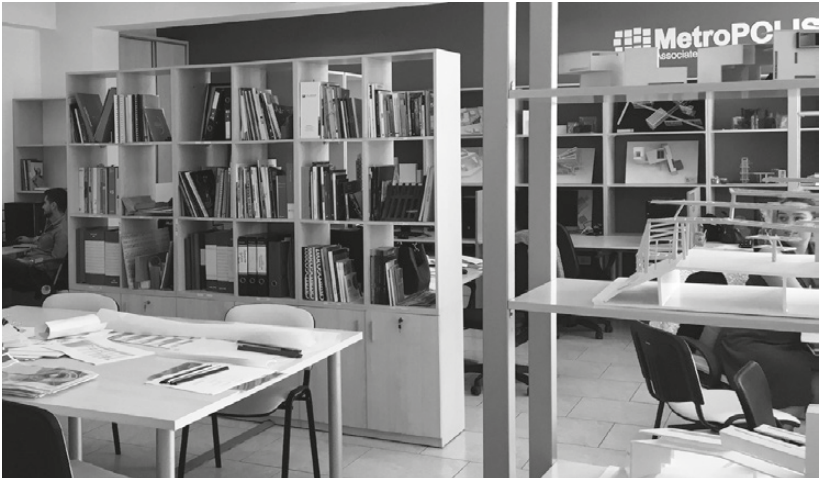
Offices of the MetroPOLIS design studio, Headquarters of POLIS University.