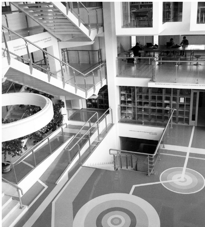
Interior spaces at POLIS University, Albania.

la Tirana Architecture Week 8 e la Tirana Design Week 9 , eventi biennali che si susseguono. TAW e TDW creano una piattaforma d'incontro tra professionisti, ricercatori e abitanti, cercando di innescare in città processi incrementali di partecipazione e riappropriazione degli spazi pubblici. (Ledian Bregasi)