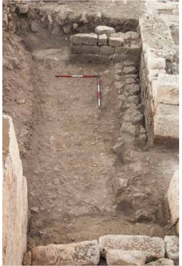
Fig. 5 Residential Quarter. Res. 5 Konut Alanı .

The excavations in Southwestern Necropolis (Fig. 6) involved three funerary buildings, lying on two different terraces of the slope, and the surrounding area. Tomb 1, on the higher terrace, is an L-shaped building made of