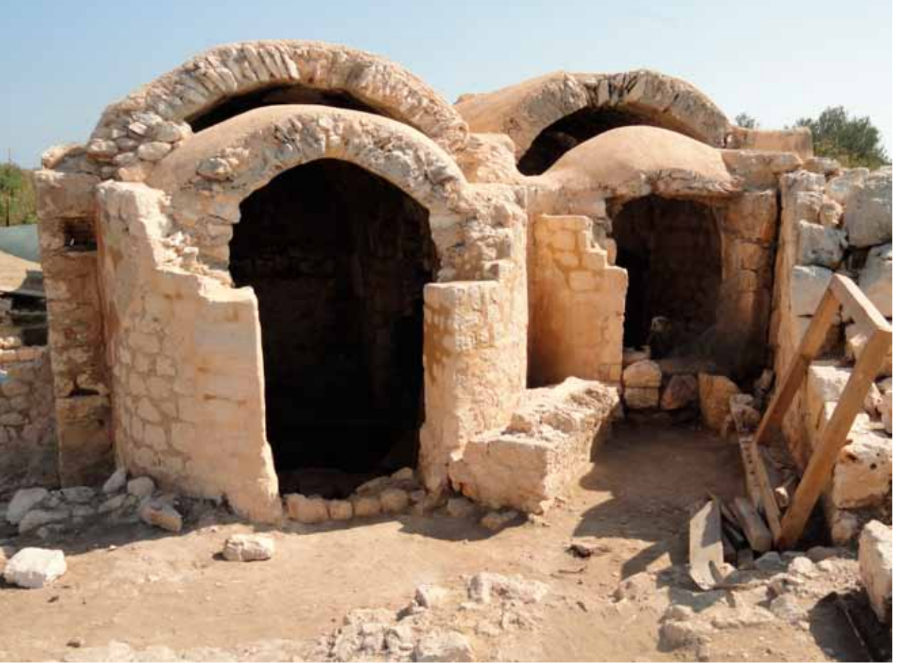
Fig. 8 Vaulted Rooms of the Little Baths Restorations.