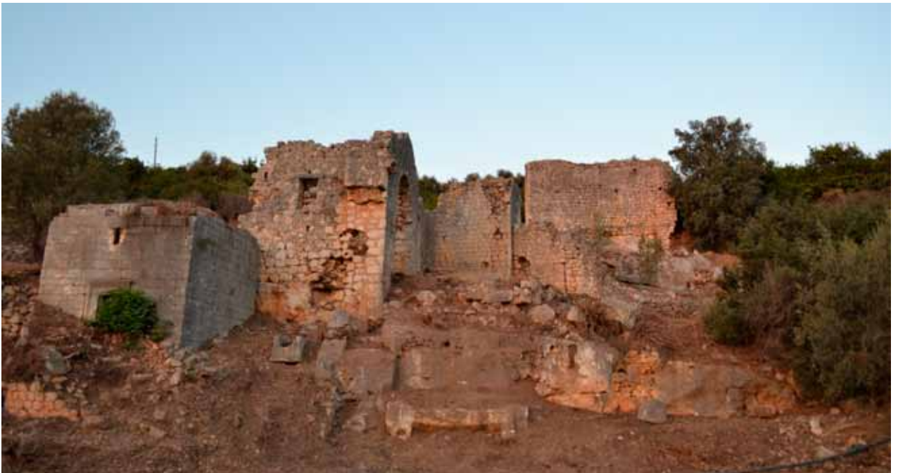
Fig. 6 Southwestern Necropolis.