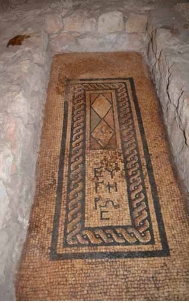
Fig. 7 Soutwestern Necropolis Mosaic of Tomb. Res. 7 Güneybatı Nekropolis mozaikli mezar.

small blocks and situated on bedrock on its eastern side. It has a plain roof on the outer side and a vaulted ceiling on the inner. It is divided into three different funerary rooms, of which the southern one has been investigated.