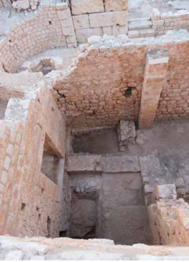
Fig. 2 Basilica of the Great Baths, stratigraphical sounding. Res. 2 Büyük Hamam Bazilikası, stratigrafik sondaj.