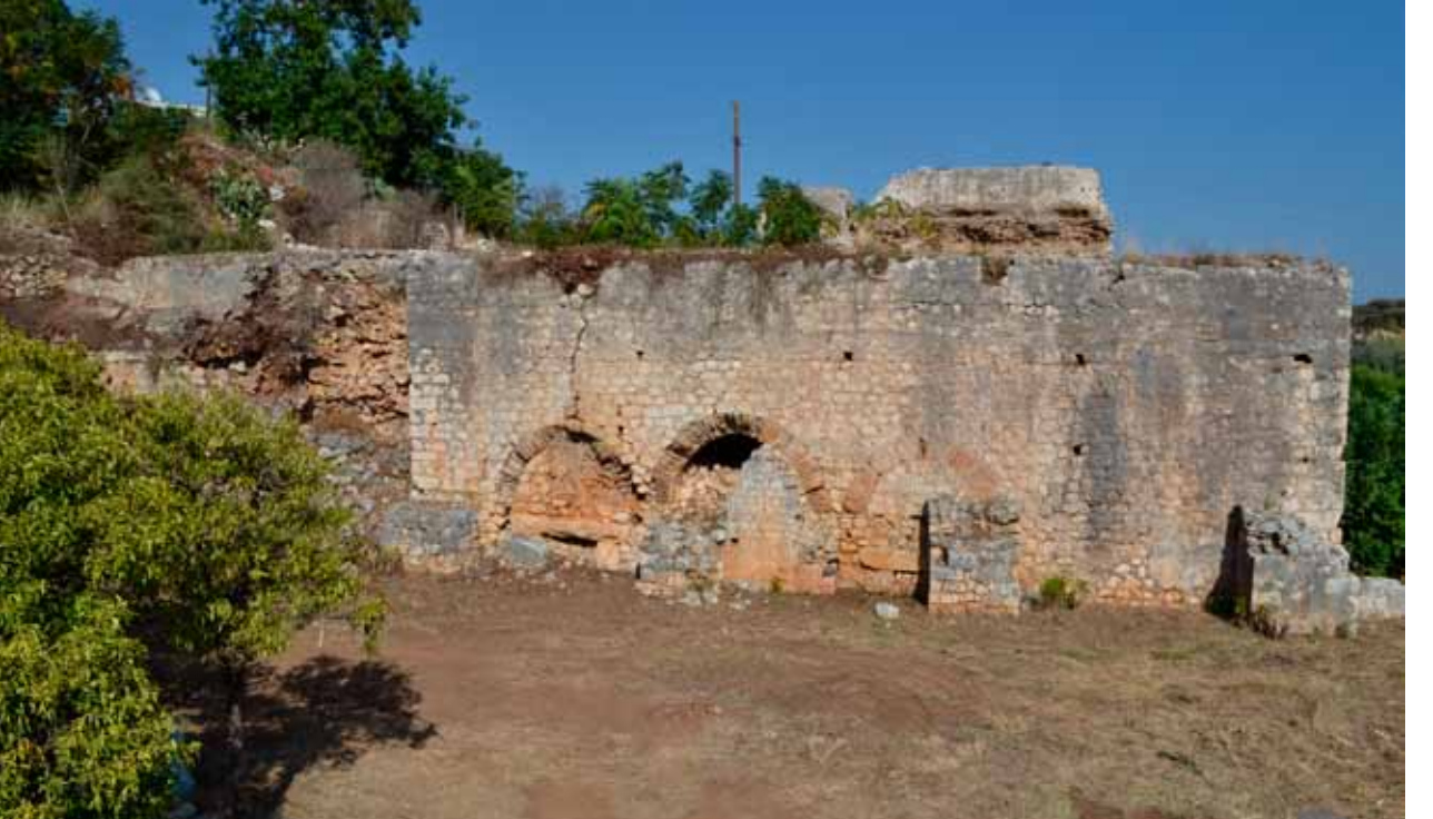
Fig. 3 Great Baths.

Diğer yanda, nartheks ve apsis alanında bir kazının gerçekleştirilebilmesi amacıyla büyük bir çalışma yapılmıştır. Mimari fragman yığınları kaldırılmış ve Kuzey Ek Yapı'nın doğusundaki yamaç temizlenmiştir. Böylece Büyük Hamam Kompleksi ve Bazilika Kompleksi arasındaki bağlantıyı görmek mümkün olmuştur (Res. 3). Söz