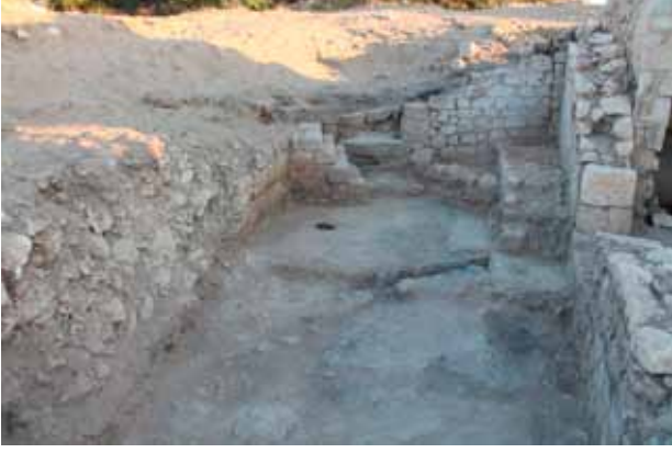
Fig. 4 Little Baths.