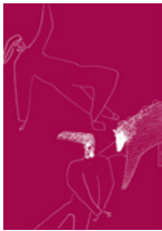
Dibujo de la portada: Anju Rame

Si has recibido este escrito, es porque te lo ha compartido uno de sus creadores o persona cercana a ellos. Sé responsable con él, difunde pero no te lucrees ni lo modifiques ni hagas un uso irresponsable de él. Somos partidarios de compartir cultura, pensamiento e ideas, estamos juntos en esto, ¡Esperamos que lo disfrutes!