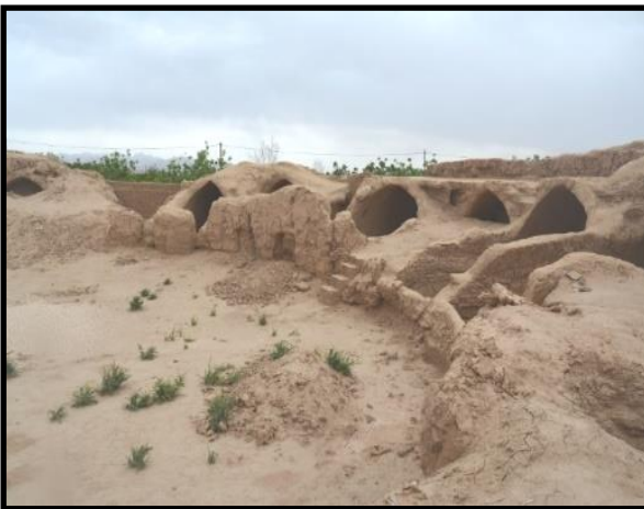
شکل ۴. فضای داخلی دخمه

هوف، استودان شهر ری را، که خواجه نظام‌الملک در کتاب خود به آن اشاره کرده است، ترکیبی (استودان و دخمه) می‌داند که هم برای در معرض قراردادن جسد و هم به عنوان محل جمع‌آوری استخوان‌های پاک‌شده کاربرد داشته است. وی معتقد است پیش از اسلام نیازی به دخمه‌های ترکیبی نبوده و احتمالاً این نوع دخمه‌ها مربوط به بعد از اسلام است. در قرون اولیه اسلامی، این برج‌ها در ایران پدید آمد و طرح آن را پارسیان هند از زرتشتیان ایران گرفتند (Huff, 2004: 619). یک نمونه دخمه دوجداره در روستای شریف‌آباد یزد وجود دارد که حصار مدور پیرامون دخمه، آن را از سایر دخمه‌ها متمایز کرده است (مهرآفرین و حیدری، ۱۳۹۴: ۱۴۷). این دخمه نمونه‌ای از تغییرات ناشی از اوضاع و احوال اجتماعی است، چراکه، بنا به نوشته بویس، به دلیل جلوگیری از تعرض مسلمانان بعد از ساخت دخمه، دیوار مدور پیرامون دخمه ساخته شده است (Boyce, 1979: 193). شاید منظور خواجه نظام‌الملک از دخمه دوپوشش چنین دخمه‌ای بوده است.