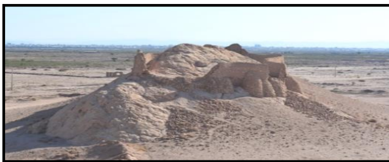
شکل ۳. نمای عمومی دخمه قدیمی کرمان

بررسی ساختار دخمه‌های موجود پارسیان نشان می‌دهد که پارسیان با حفظ ساختاری که هم موضوع خورشیدنگرشی و در معرض پرنده‌گان لاشخور قرار دادن جسد را تأمین کرده و هم از آلوده کردن زمین جلوگیری می‌کند، همراه با پیشرفت موقعیت اجتماعی خود در جامعه هند، به پیچیدگی‌های این ساختار نیز افزوده‌اند.