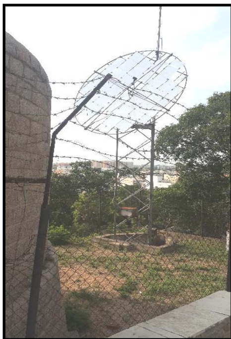
شکل ۲. نمونه‌ای از سولار؛ سیستم استفاده‌شده در دخمه‌های پارسیان

برخی معتقدند باید ساختمانی مخصوص لاشخورها در اطراف دخمه بسازند و