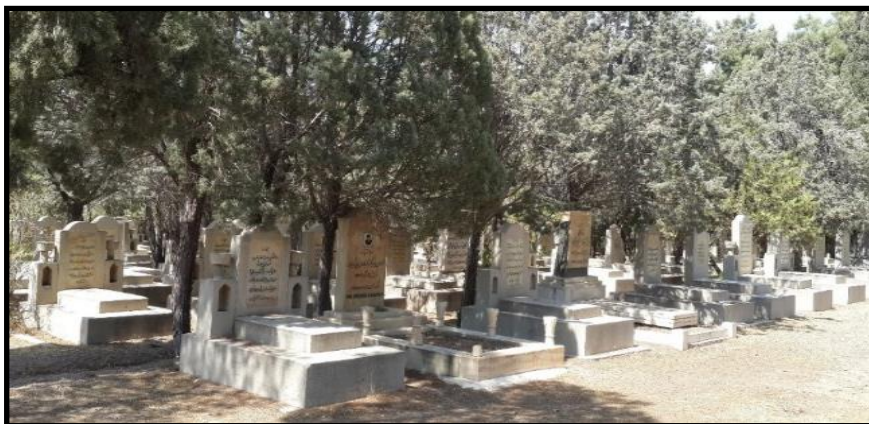
شکل ۵. آرامگاه زرتشتیان امروزی، آرامگاه قصر فیروزه، تهران

آب و هوای گرم و خشک ایران برای رسم دخمه‌گذاری نسبت به آب و هوای هند، مناسب‌تر بود و حصارکشی ستیغ یک کوه دورافتاده نیز، هدف دینی‌شان را برآورده می‌کرد. زرتشتیان محافظه‌کار ایران برای حفظ این رسم و کاستن فشارهای اجتماعی و سیاسی، تمام