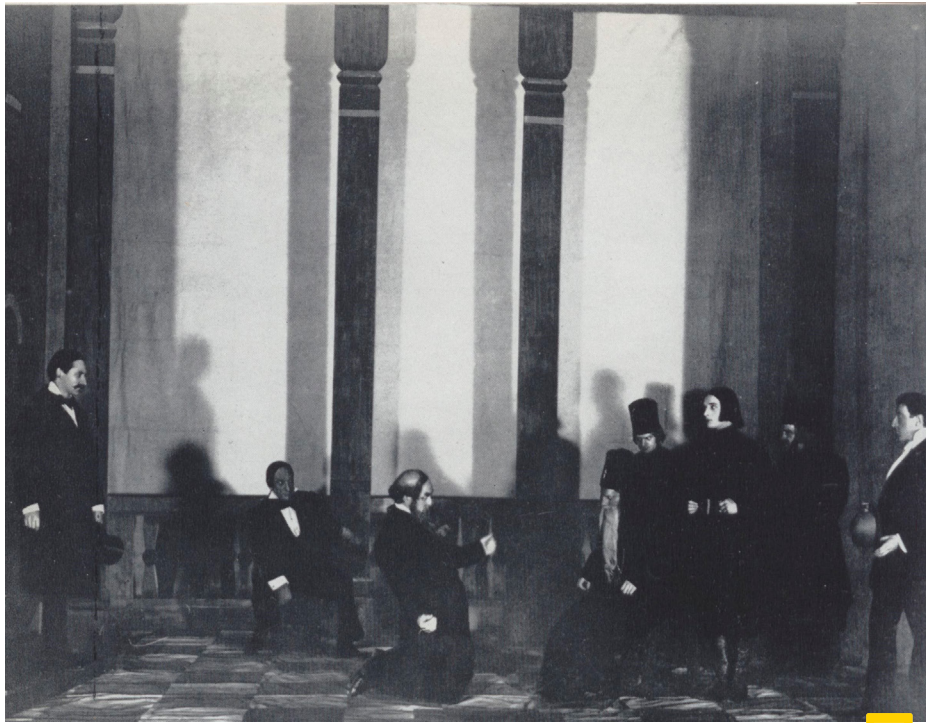
Figura 2. Les frères Karamazov , atto I, Théâtre du Vieux-Colombier, 1914, BNF.