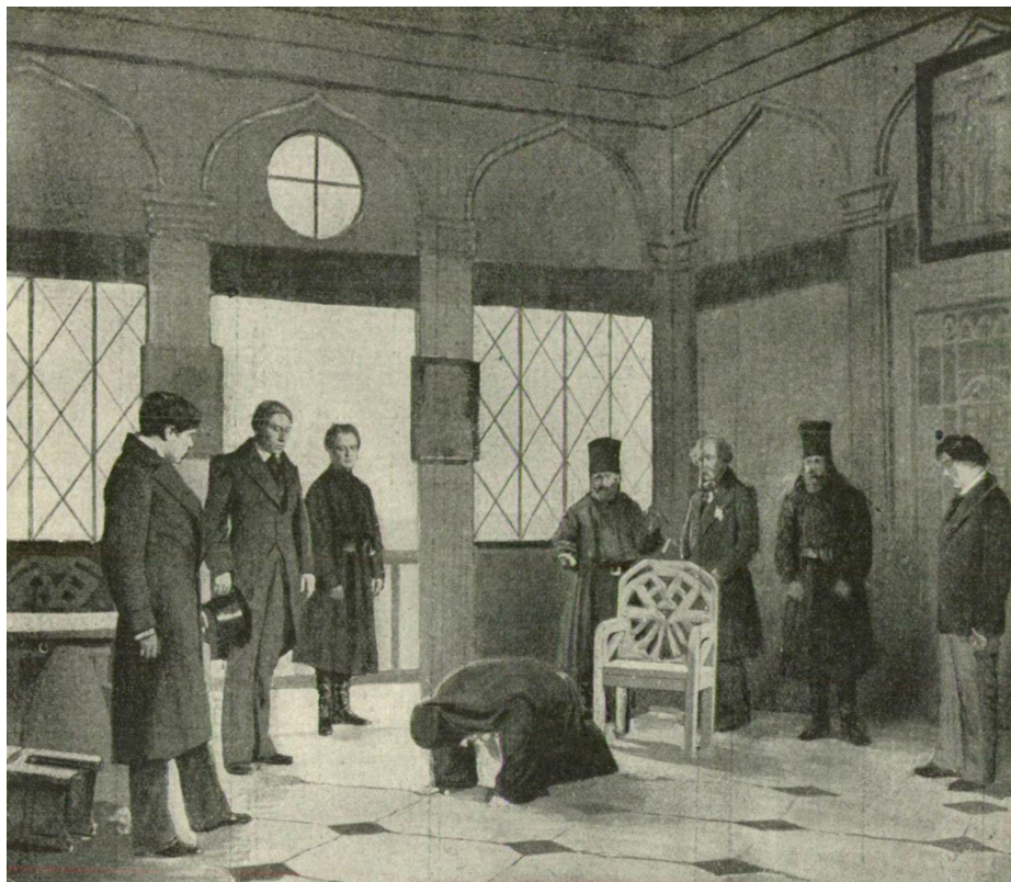
Figura 1. Les frères Karamazov , atto I, Théâtre des Arts, foto Bert, «L'illustration théâtrale», 1911.

L'articolo Regia e romanzo , di Marta Marchetti, nel fascicolo Mimesis Journal 9:2 è stato impaginato privo delle illustrazioni previste, che stampiamo qui di seguito. Il presente materiale è da ritenersi parte integrale del suddetto fascicolo.