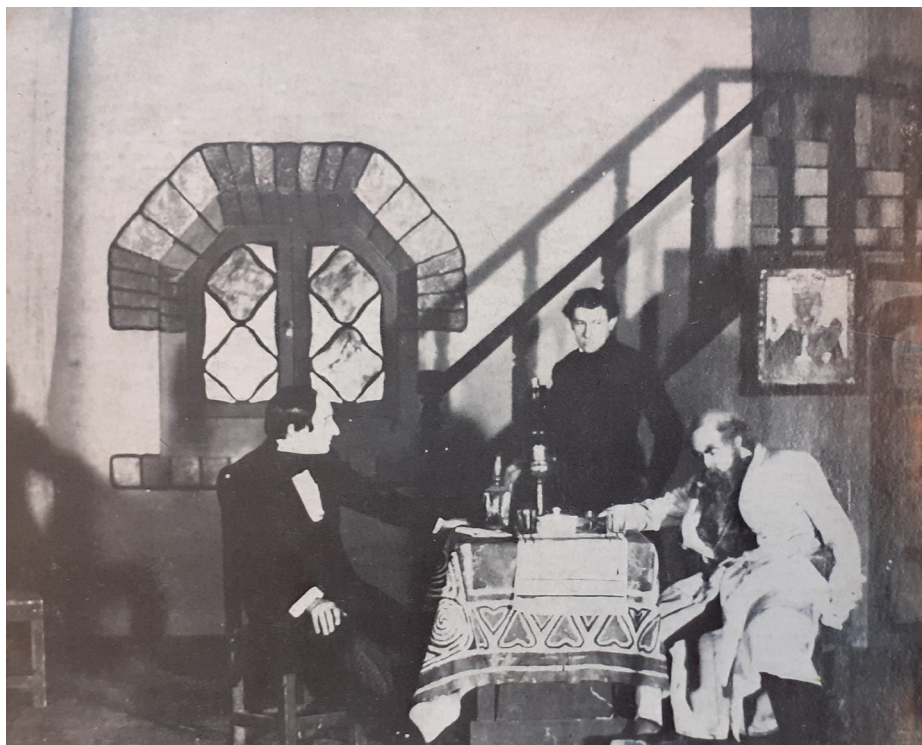
Figura 3. Les frères Karamazov , atto III, Théâtre du Vieux-Colombier, 1914, in «L'Avant-scène théâtre» 1971.