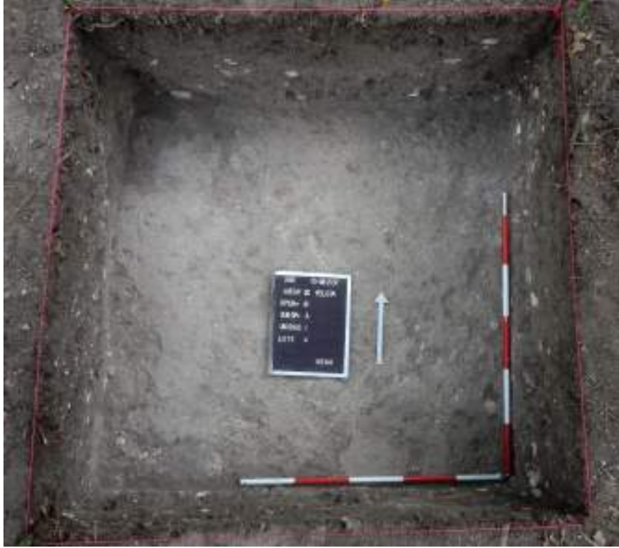
Figura VI-2: Nivel de piso de la cancha del juego de pelota (Lote 4) con vista desde el lado sur del sondeo