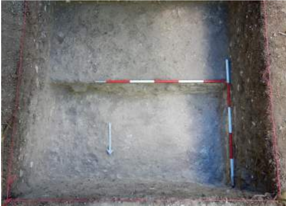
Figuras VI-5: Foto de la capa de relleno (Lote 6) tomada desde el lado norte del sondeo