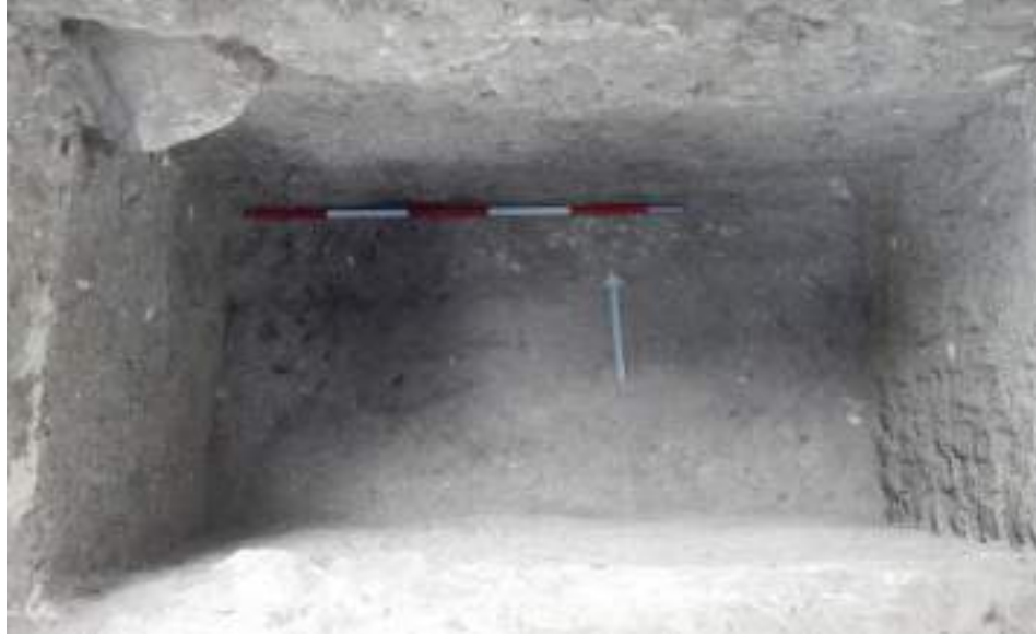
Figura VI-8: Detalle del Lote 8. Foto tomada desde el nivel de piso de la cancha