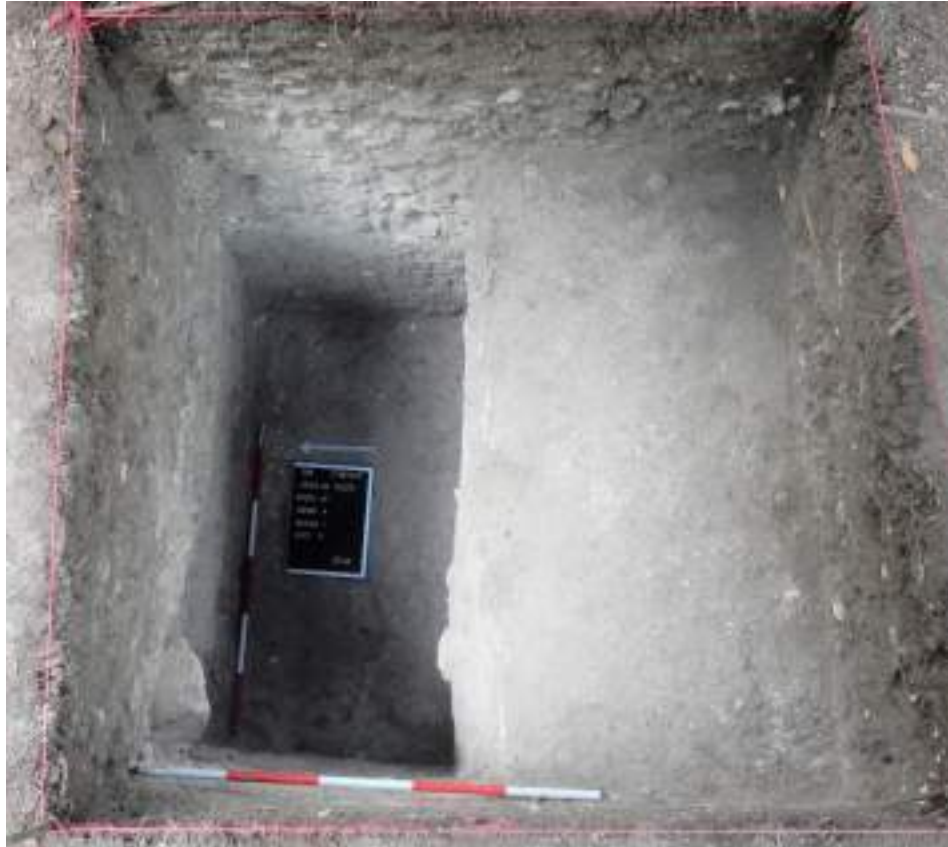
Figura VI-7: Estrato compacto debajo del nivel del juego de pelota (Lote 8) que se dejó no excavado

Lote 8 (SAK 41-A-1-8): 1.95 m. Estrato compacto que no se excavó debido que corresponde a un nivel debajo del juego de pelota, parte de la plataforma de base.