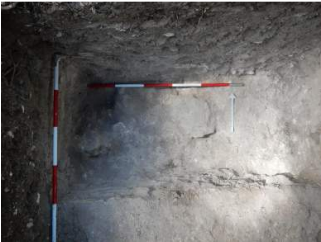
Figura VI-6: Piedras grandes y medianas encontradas excavando la capa de relleno (Lote 6)