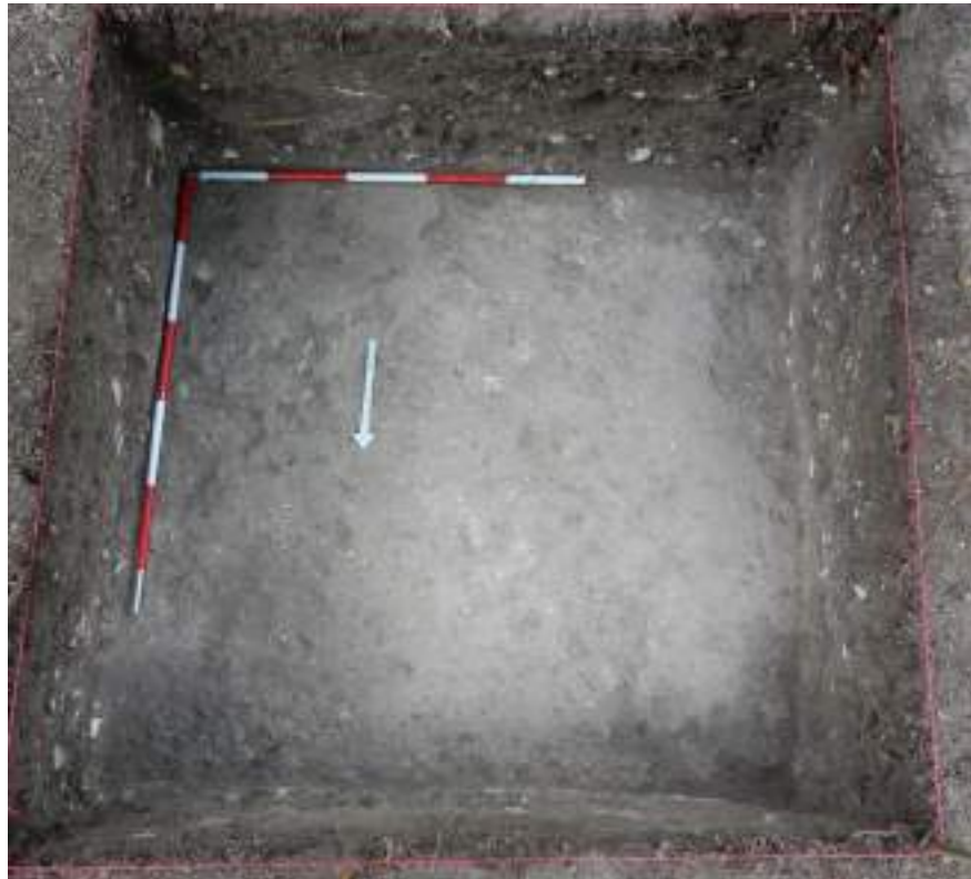
Figura VI-3: Foto del piso de la cancha (Lote 4) tomada desde el lado norte del sondeo