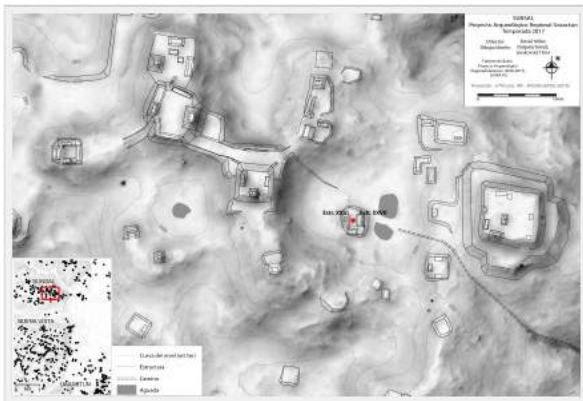
Figura VII-1: Mapa del sitio Sunsal y de su área de ubicación al noroeste de Uaxactún. En rojo están evidenciados el sitio y el sondeo de la operación 42-A al centro de la cancha (elaboración por Tomás Drápela y Tibor Lieskovský, modificado por María Felicia Rega)