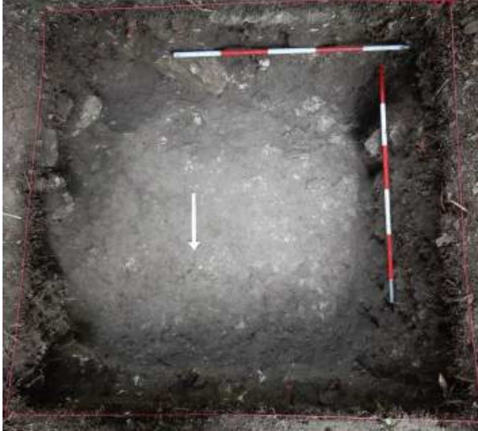
Figura VII-4: Foto del probable piso (Lote 3) tomada desde el lado norte del sondeo. Hay algunos puntos donde el estrato no es totalmente nivelado

Lote 4 (SUN 42 A-1-4): 0.67 – 0.95 m. Mezcla de tierra gris y pedrín (7.5 YR 7/1) muy compacto. Se excavó solamente la mitad sur del sondeo (1.5 x 0.70 m). La capa tuvo un grosor promedio de 0.28 m. Se recolectaron 32 tiestos y ocho fragmentos de lítica.