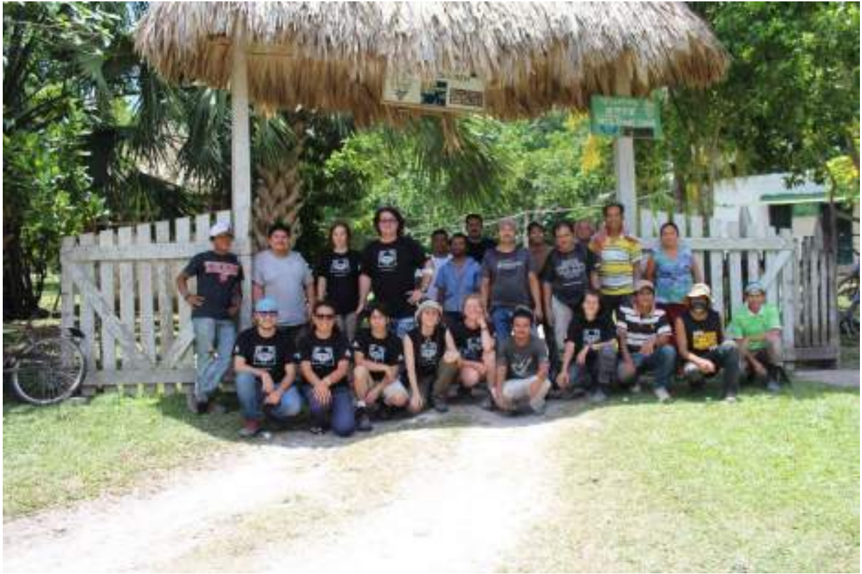
Equipo del Proyecto Uaxactun PARU 2017