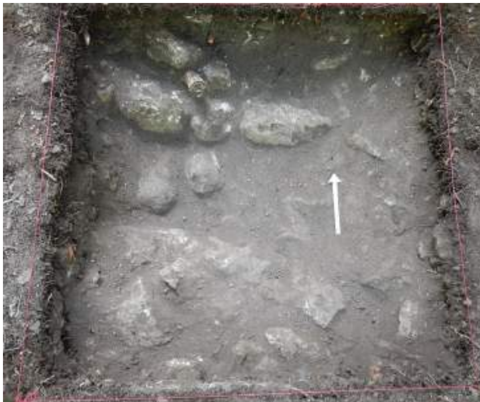
Figura VII-2: Nivel de derrumbe con tierra suelta y muchas piedras grandes

Lote 3 (SUN 42 A-1-3): 0.61 – 0.67 m. Estrato muy compacto de pedrín (10 YR 6/2) que se interpretó como un nivel de piso con un grosor de 0.06 m. En el lado sur del sondeo, cerca de la esquina suroeste, se encontró un hueco en el perfil, sin embargo era solo un espacio vacío dejado por el piso. Se recolectaron 30 tiestos y dos fragmentos de pedernal.