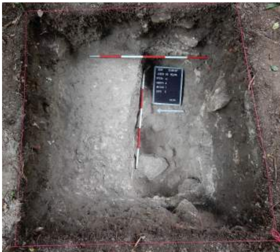
Figura VII-5: Estrato de piedras y tierra suelta (Lote 5). Se pensó a otro nivel de derrumbe o a un probable relleno debajo del piso