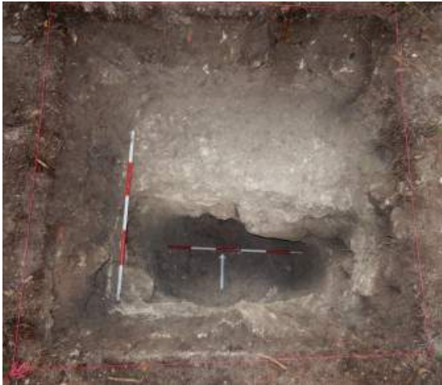
Figura VII-7: Nivel de roca madre (Lote 7)

Lote 7 (SUN 42 A-1-6): 1.66 m. Roca madre.