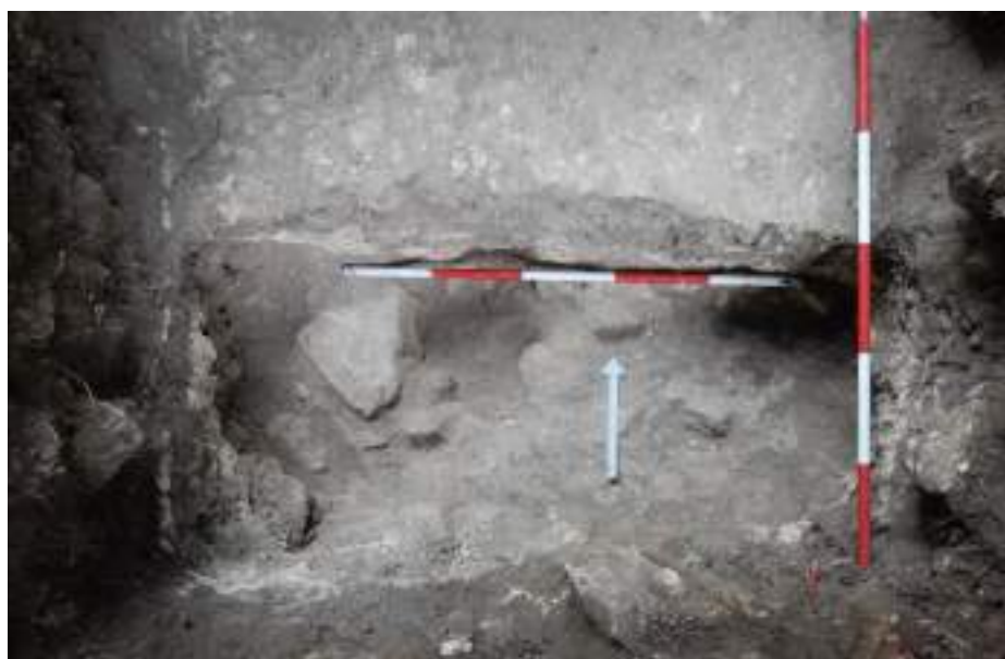
Figura VII-6: Foto del Lote 5 tomada desde el lado sur del sondeo