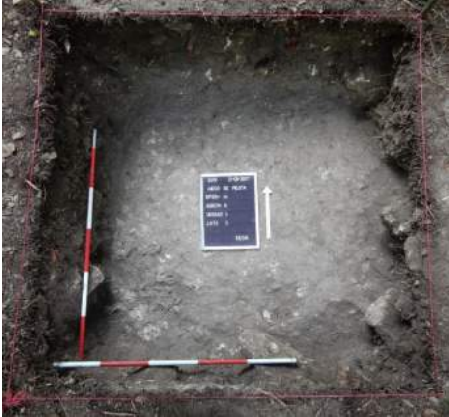
Figura VII-3: Estrato de piedrín muy compacto interpretado como piso