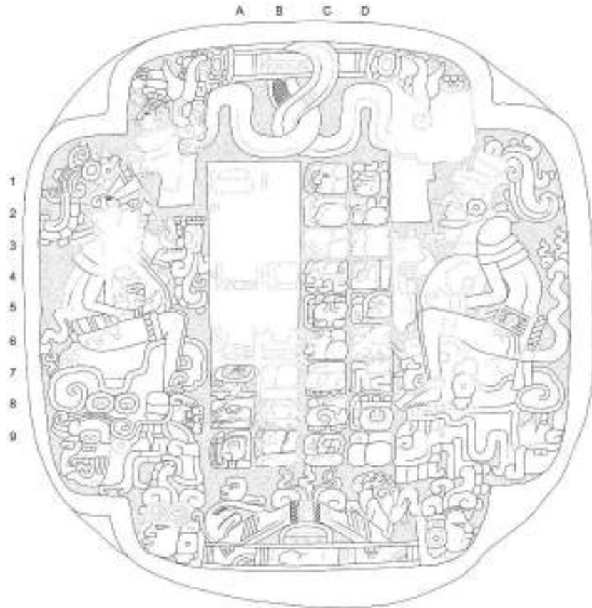
Marcador de El Chival/Buena Vista Dibujo Alexandre Tokovinine