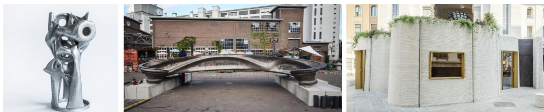
Figura 2: Stampa 3D per la struttura - lo Smart Node in acciaio (©Arup), il MX3D Bridge (©MX3D), 3Dhousing05 CSL Architetti (©CSL Architetti)

La realizzazione delle parti strutturali è sicuramente un tema centrale nella ricerca sull'applicazione della stampa 3D al settore delle costruzioni ( Fig. 2 ). Un caso studio paradigmatico è quello dello Smart Node , un nodo in acciaio di collegamento tra aste secondo un sistema a configurazione variabile, 'stampato' con un approccio diretto mediante la tecnologia Powder Bed Fusion , proposto da Arup dal 2014 all'interno di una serie di