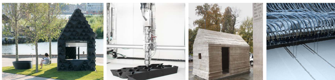
Figura 4: Stampa 3D integrata - Urban Cabin 3D Print Canal House (© AECTUAL, © Sophia van den Hoek), Casatuttadiunpezzo Marco Ferreri e D-Shape (© Miro Zagnoli, ©Dinitech)