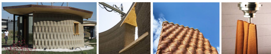
Figura 3: Stampa 3D per l'involucro - Gaia (© WASP), Sistema costruttivo a blocchi IAAC (©G.Paparella, ©Pylos, a project of IAAC, developed within the OTF program, by Sofoklis Giannakopoulos)

Il tema dell'ottimizzazione è centrale anche con riferimento a soluzioni non propriamente strutturali, in cui la flessibilità della macchina può rivelarsi particolarmente utile a migliorare le prestazioni dell'involucro, elemento di fondamentale importanza in quanto limite e interfaccia tra il fuori e il dentro ( Fig. 3 ). Il caso del progetto Gaia realizzato nel 2018 da WASP, esprime il suo valore sperimentale, oltre che nella possibilità di realizzare un elemento continuo di tamponatura in relazione alle specifiche condizioni climatiche del sito (secondo