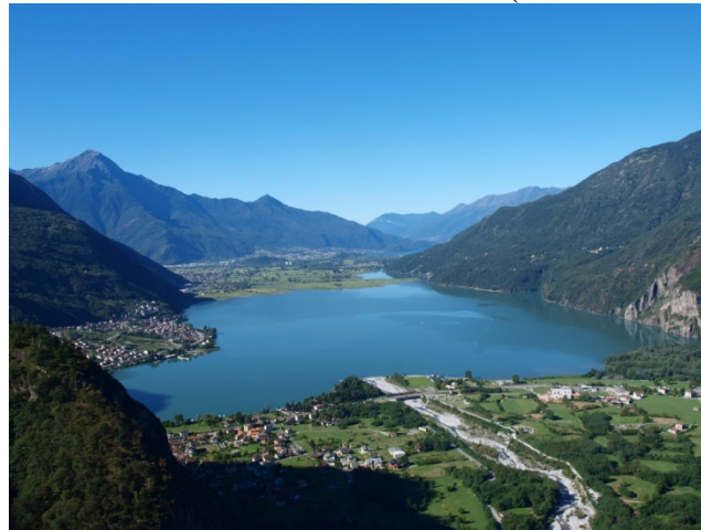
FIGURA 1. PANORÁMICA LAGO DE NOVATE MEZZOLA

No obstante el valor natural e histórico y la fragilidad de la zona, en los años 60 se concedió el permiso de colocar una actividad de producción de acero ocupando un área industrial de 70 mil hectáreas, deformando un paisaje único según un típico proceso de estandarización bien descrito por Turri (1967). La fábrica desde 1965 hasta 1991 trabajó 13.500 toneladas de liga fierro-cromo super refinado, utilizando como materias primas minerales de cuarzo, cromo, calcar, carbón (De Vecchi, Bosisio, 1978; Ferrari 1982). Es un proceso metalúrgico que además de contaminar aire y agua, produce escorias. Parte de las