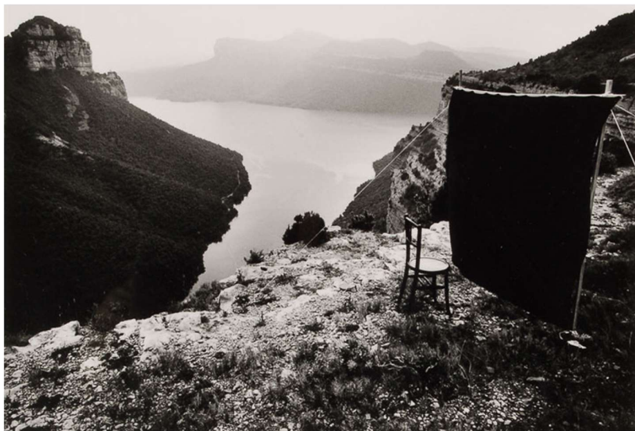
Vuoi guardare il muro... Ettore Sottsass, Metafore , 1972-1979.