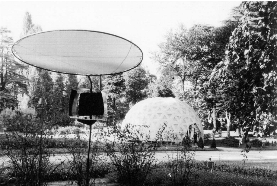
Joe Colombo, Edicole televisive alla triennale di Milano, 1954.