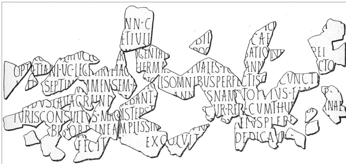
Fig. 2. Iscrizione relativa al restauro delle terme di Thuburbo Maius nel 361 d.C. Immagine tratta da ILAfr 273.

v(iri) c(larissimi), p]roc(onsulis) [p(rovincia) A(fr)icae et le]gatione [Crepe]rei / Optatiani, v(iri) c(larissimi), leg(ati) Karthag(inis), [t]hermas [aes]tivales po[s]t ann[os solidos] octo, / i[n]tra septimum mensem, a[d]iectis omnibus perfectisq[ue] cuncti[s] / [qu]ibus lavacra ind[i]gebant, Ann[i]us Namptoi[us] fl(am)en[us] [p(er)]p(etuus), / iuris consultus, magister st[udiorum], cur(ator) rei p(ublicae), cum Thub[ur]bi[et]anae / [u]rbis ordine amplissim[o] cunct[a]que eius plebe / [per]fecit, excoluit, dedicavit.