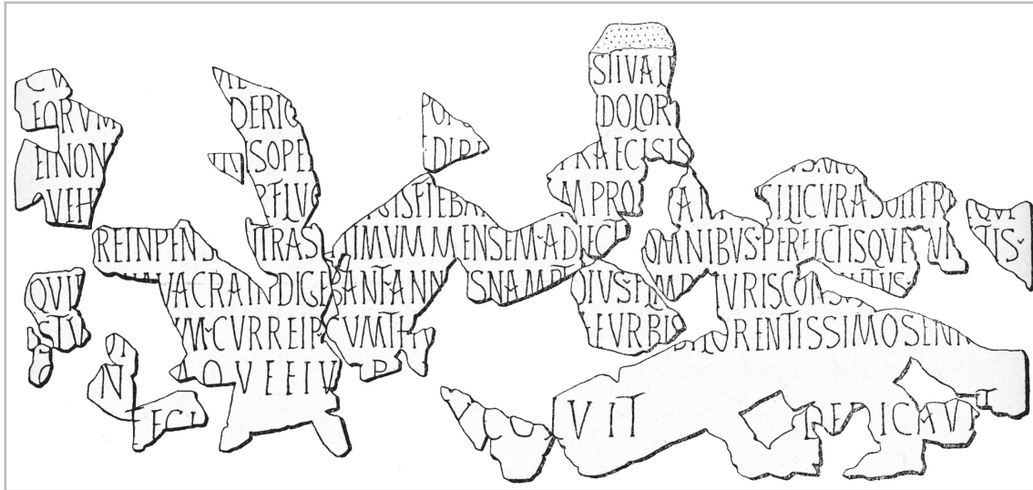
Fig. 1. Iscrizione relativa al restauro delle terme di Thuburbo Maius promosso da Annius Namptoius . Immagine tratta da ILAfr 273.