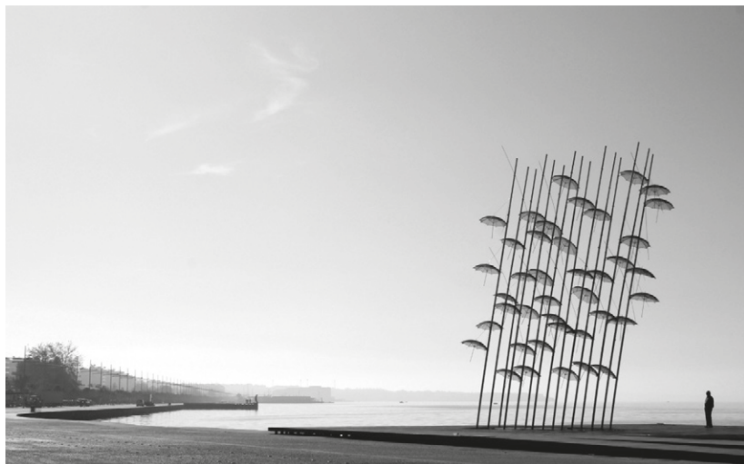
Fig. 4. Nikiforidis - Cuomo Architects, Nuovo Waterfront, Thessaloniki, Greece, 2014. Winner, UIA Prize Architecture for All_Friendly Spaces Accessible to All.