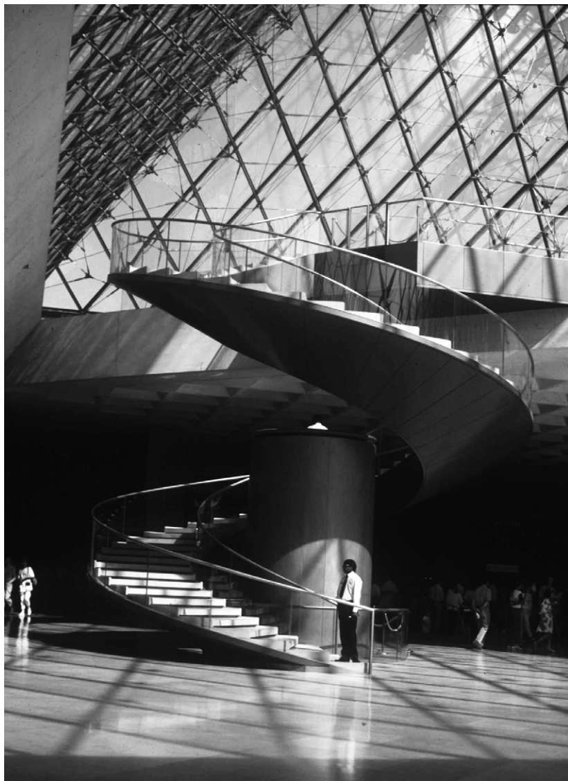
Fig. 7. Ieoh Ming Pei, Louvre Piramide, Parigi, 1989. The spiral ramp and the elevator platform.