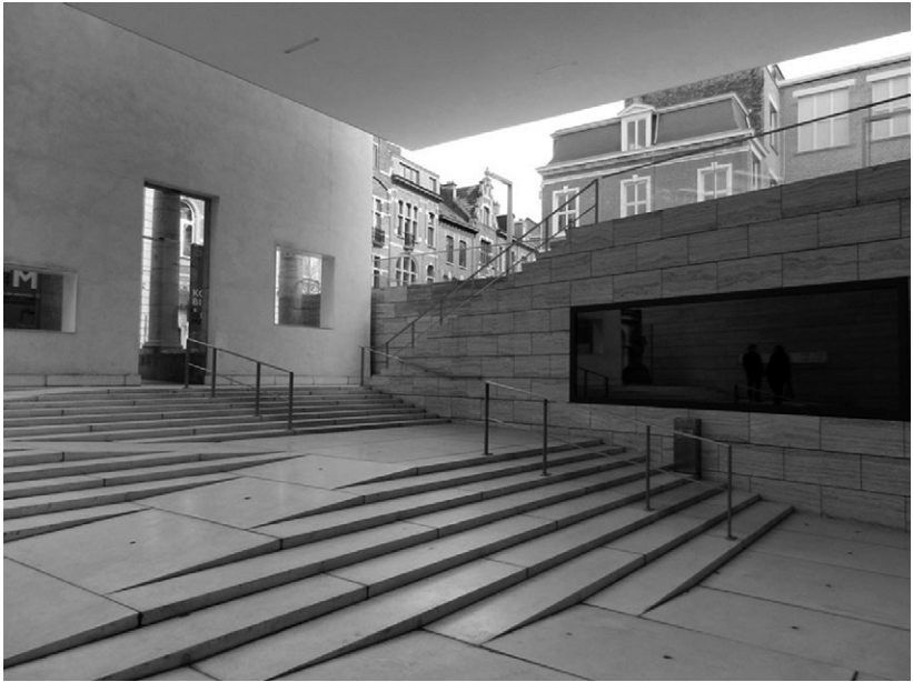
Fig. 8. Entrance at Museum M, Leuven, 2009. (from presentation by Research [x] Design équipe).