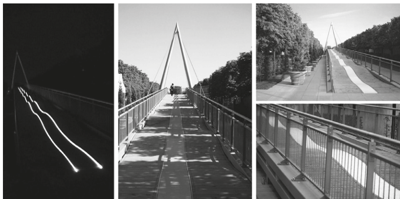
Fig. 5. Slope Expo 2000, Hannover (from presentation by Research [x] Design équipe) © Kamel Louafi.