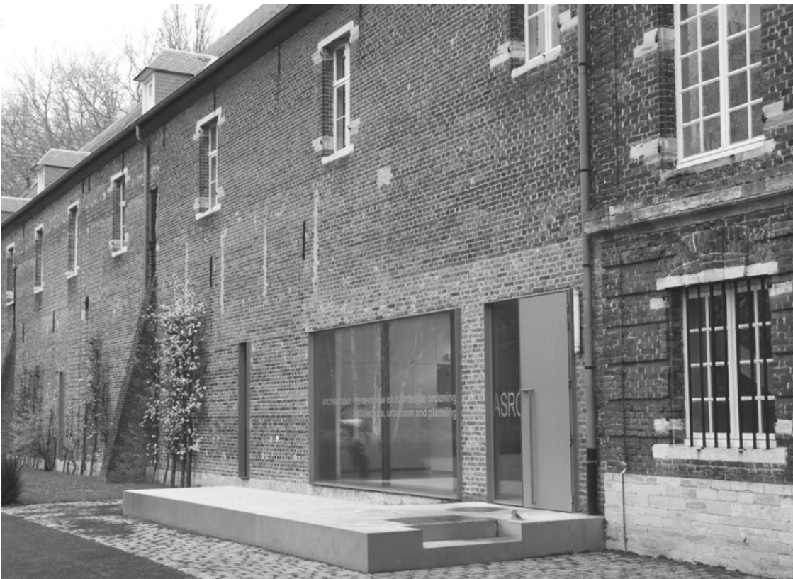
Fig. 6. Entrance Department of Architecture_University KU Leuven. (from presentation by Research [x] Design équipe) © Hasa Architecten.