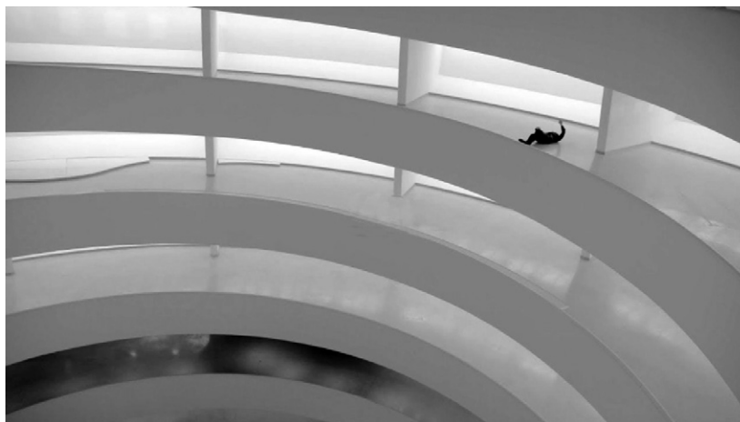
Fig. 1. Frank L. Wright, Guggenheim Museum, New York. The interior ramp.

fa maturare sensibilità verso il dettaglio, il non-udente registra gli odori e misura il gradiente visivo e luminoso meglio degli altri... Più delle teorie, nel nostro campo, valgono poi le cose fatte, gli esperimenti condotti. Una sezione importante del ciclo di lezioni condotte nel Laboratorio di Progettazione, è stata quella dedicata alla presentazione dei casi studio e alle esplorazioni effettuate dall'équipe "Research [x] Design", relativamente sia allo spazio pubblico che al privato. Un approfondito lavoro è stato sviluppato relativamente al patrimonio storico, presentando gli studi effettuati su alcuni edifici tutelati del Campus Universitario di Leuven. Altrettanto istruttiva è stata la presentazione di particolari soluzioni domestiche e, in special modo, l'esempio della casa progettata da una persona disabile motoria, di professione architetto 21 .