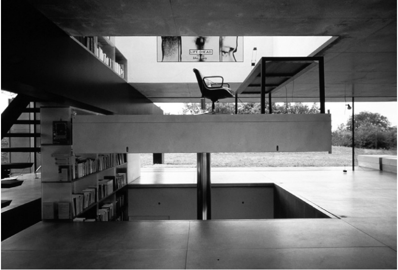
Fig. 2. Rem Koolhaas_Casa Lemoine a Floirac, Bordeaux, 1994-1998. The elevator platform.