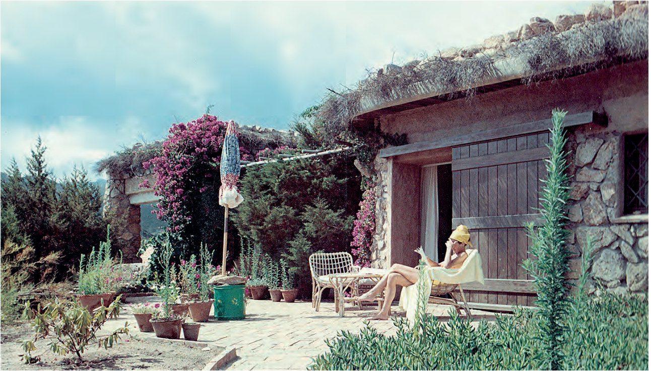
Fig. 9-10 Luigi Vietti, Hotel Pitrezza, terrazza privata della stanza e piscina, foto del 1966.