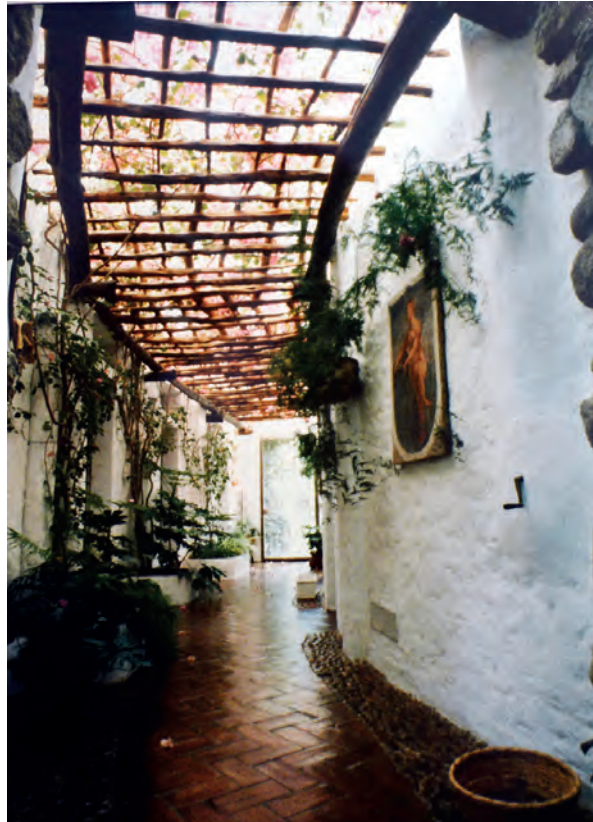
Fig. 11 Luigi Vietti, villa La Cerva, 1962-63

rare uno spazio il quale, anche in questo caso, fu chiamato “piazzetta”. La costruzione venne realizzata recuperando i materiali e i modi di lavorazione locali. Poco tempo dopo la conclusione del cantiere Vietti decise di colorare i fronti utilizzando colori non omogenei, che potessero suggerire un invecchiamento 17 .