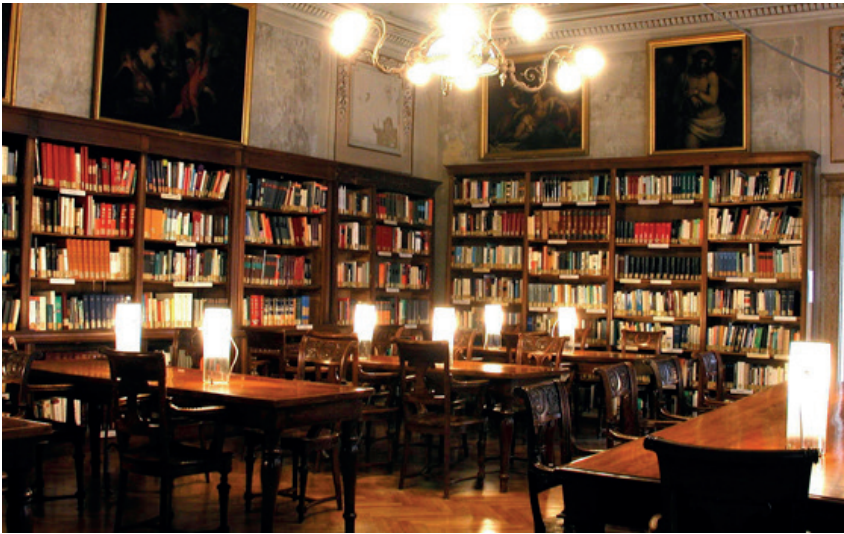
La Biblioteca Querini Stampalia

sentivano fortunati quando riuscivano a catturare una manciata di pesciolini in acque da cui un tempo le loro barche tornavano sempre cariche.