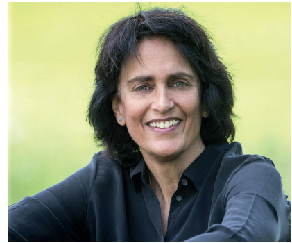
La scrittrice Sue Halpern

La quindicenne Sunny arriva in biblioteca quasi all’inizio della storia, presentandosi il primo giorno con una “maglietta maschile bianca con un grande punto interrogativo disegnato con il pennarello nero sul davanti” e spiegando che “aveva fatto la maglietta pensando alla gente che entrava in biblioteca e magari aveva qualche domanda”. Ci arriva per scontare una condanna del tribunale minorile per un furto decisamente anomalo: è stata colta in flagrante mentre tentava di rubare un dizionario nella libreria del centro commerciale. Al giudice del tribunale che le chiede perché volesse rubare il Dizionario Universitario Merriam-Webster , Sunny candidamente risponde che non aveva abbastanza soldi per comprarlo e aggiunge: “in realtà avrei potuto permettermi l’edizione tascabile, ma i tascabili non durano. Le pagine si staccano, e a cosa serve un dizionario se gli manca qua e là qualche pagina? Vai a cercare una parola che non c’è e non puoi nemmeno provare che ci fosse. L’edizione