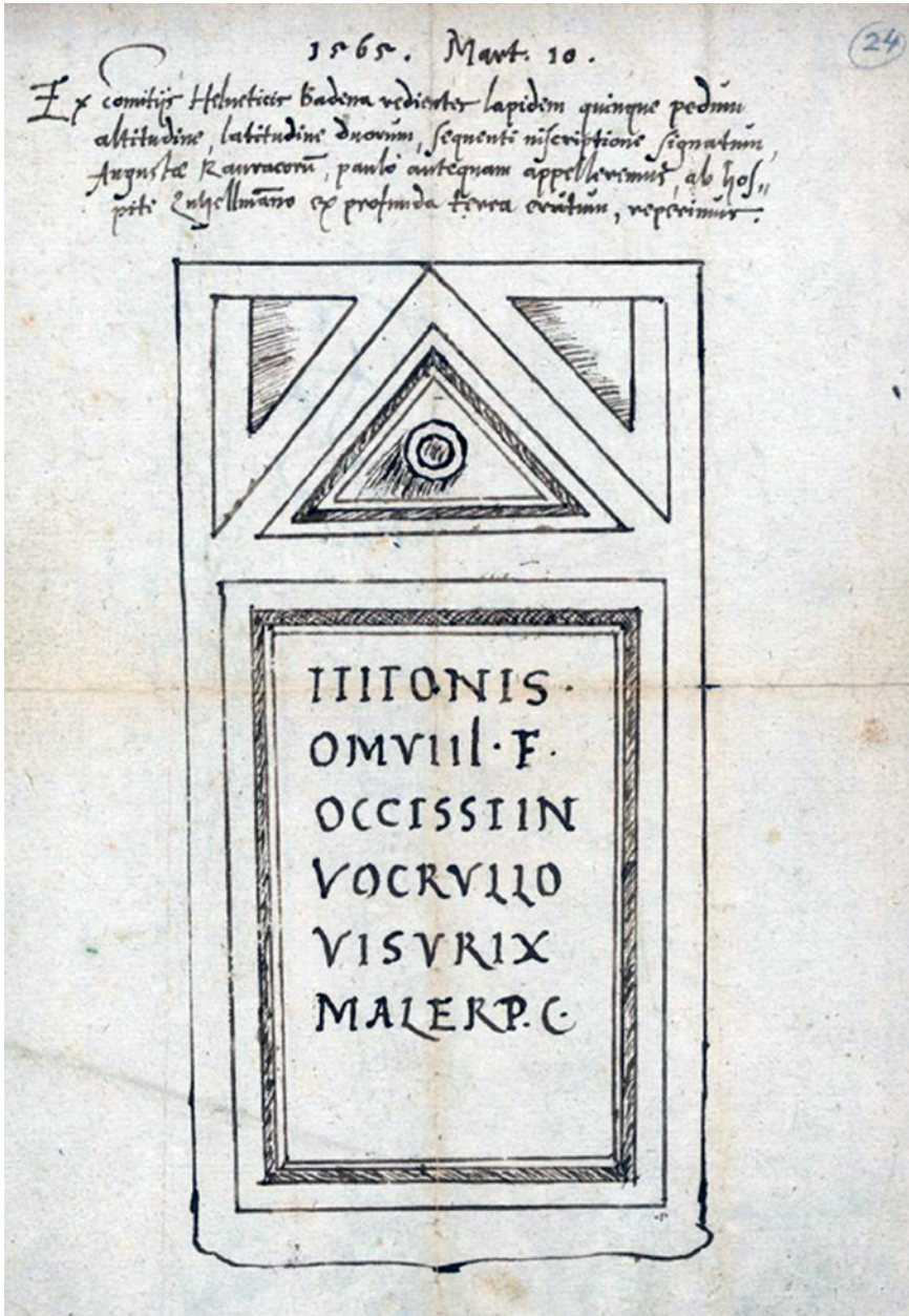
Figura 1 Basel, Universitätsbibliothek, c. 24r del Cod. CVIa 77. Amerbach, Bonifacius: Sammlung lateinischer Inschriften . 16. Jahrhundert, http://doi.org/10.7891/e-manuscripta-46615