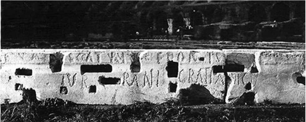
Figura 6 Roma, Colosseo. Iscrizione relativa ai loca riservati al senatore Turranius Gratianus.

dosio II e poi di Teodosio II e Valentiniano III. 15 Secondo la più recente proposta di datazione, da me avanzata seguendo una felice intuizione di Stefano Priuli, infatti, questa serie di iscrizioni si colloca in un arco cronologico compreso tra gli ultimi decenni del III secolo e la prima metà del successivo, ed è, quindi, perfettamente compatibile con il prefetto urbano del 290. 16