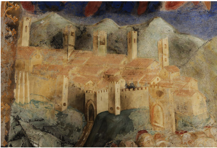
Fig. 1. Amatrice, chiesa di Santa Maria di Filetta, dettaglio dell'affresco absidale.