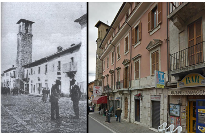
Fig. 2. A sinistra, una foto del Corso Umberto I di Amatrice nei primi anni del XX secolo; a destra la stessa inquadratura ripresa nel 2011.

sono state raccolte con l'ausilio delle piattaforme social network e social media 19 , declinate poi a strumento complementare rispetto ai metodi tradizionali 20 .