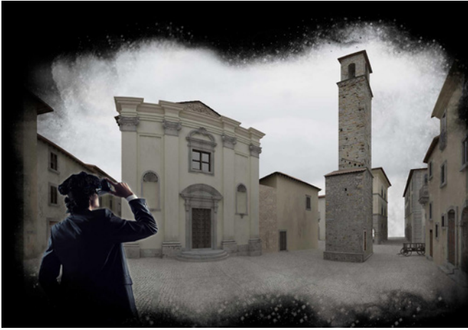
Fig. 5. Immagine illustrativa della piazza Ottocentesca di Amatrice in realtà virtuale (elaborazione di S. Lucchetti, G. Catalani, A. Mirandola, M. Storgato).

simulata, godibile attraverso degli occhiali che alienano completamente l'utente dal mondo reale che lo circonda, proiettandolo dentro uno spazio digitale 27 . Grazie alla sua natura di simulatore, il dispositivo VR si presta a facilitare efficacemente le attività di promozione e valorizzazione di beni architettonici, sia esistenti che scomparsi. Nel presente caso di studio si è scelto di sovrapporre nel simulatore VR le immagini dell'Amatrice del 2016 con la ricostruzione digitale corrispondente al plastico, con il duplice intento di fare in modo che l'utente finale possa immergersi in una città non più esistente, e passeggiare al tempo stesso tra le vie del modello in scala (Fig. 5).