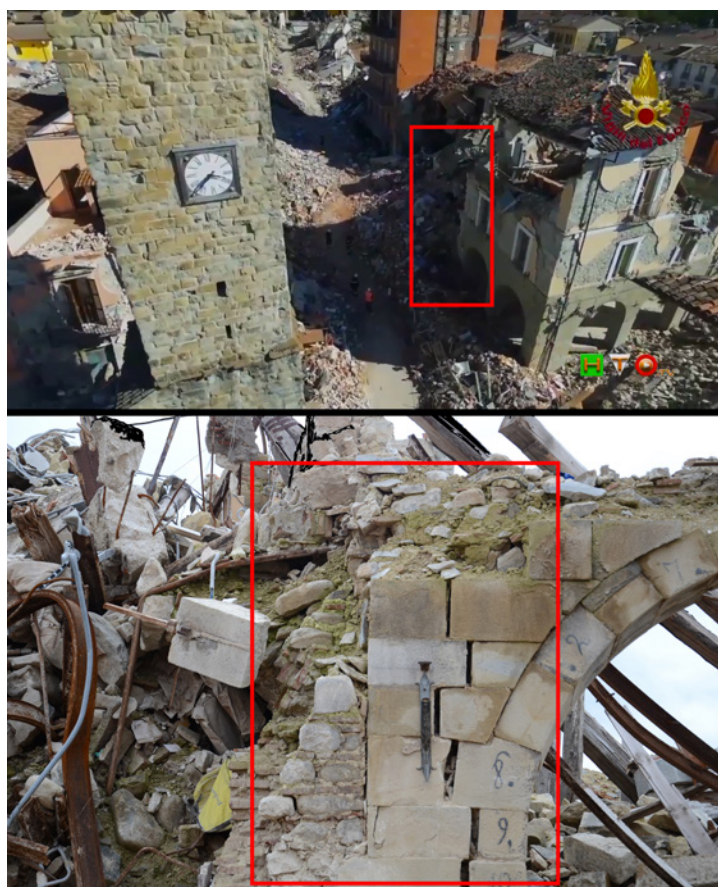
Fig. 3. Amatrice, foto aerea del palazzo Comunale nel 2016 e dettaglio della muratura.

Un ultimo caso applicativo, in corso di sperimentazione, è relativo all'inserimento della città di Amatrice all'interno di un ambiente di realtà virtuale. La realtà virtuale (in seguito VR) è letteralmente una realtà