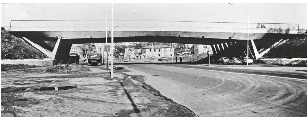
Fig. 4. Cavalcavia della via del foro Italico su Corso Francia (1958-1960), Roma. Progetto di Riccardo Morandi.