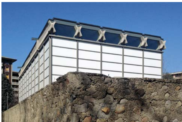
Fig. 2. Chiesa Dio Padre Misericordioso (1996-2003), Tor Tre Teste, Roma. Progetto di Richard Meier.