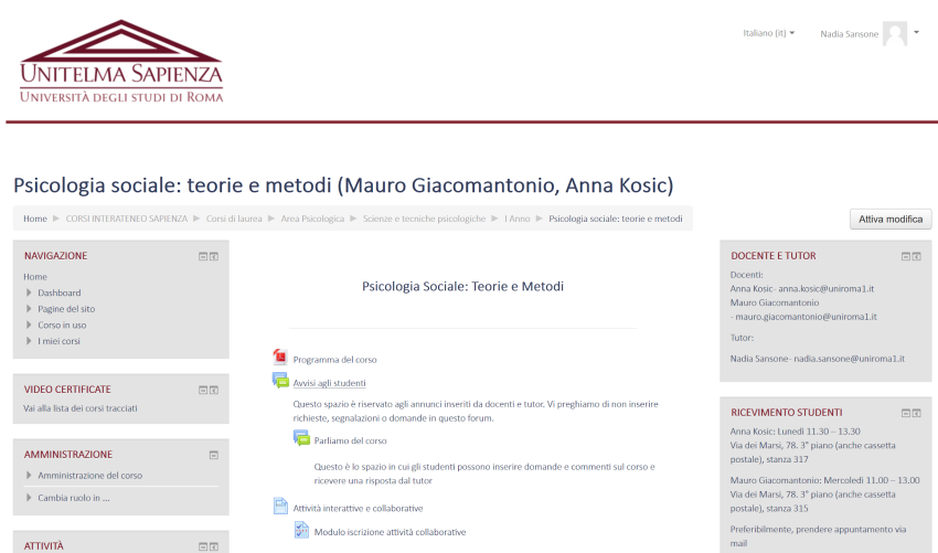
Figura 1 – La sezione introduttiva delle pagine corso su Moodle

Il corso STP di Sapienza e Unitelma Sapienza viene erogato attraverso Moodle, all'interno del quale ciascun insegnamento ha la sua pagina corso, strutturata secondo un template comune. Il template prevede una prima sezione introduttiva del corso contenente il syllabus, un forum annunci per gli avvisi di docenti e tutor, un forum per le richieste degli studenti (Fig. 1).