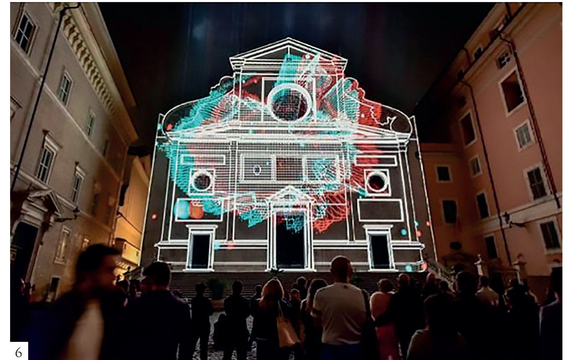
Figura 6 Nerdworking, Solid light Festival , 2018, Basilica di Sant'Agostino in Campo Marzio, piazza di S. Agostino, Roma. Video mapping con immagini stereoscopiche: l'uso di occhiali anaglifi aumenta l'interattività.

contrapposizione tra ideatore dell'immagine, comunicatore e fruitore (fig. 5).