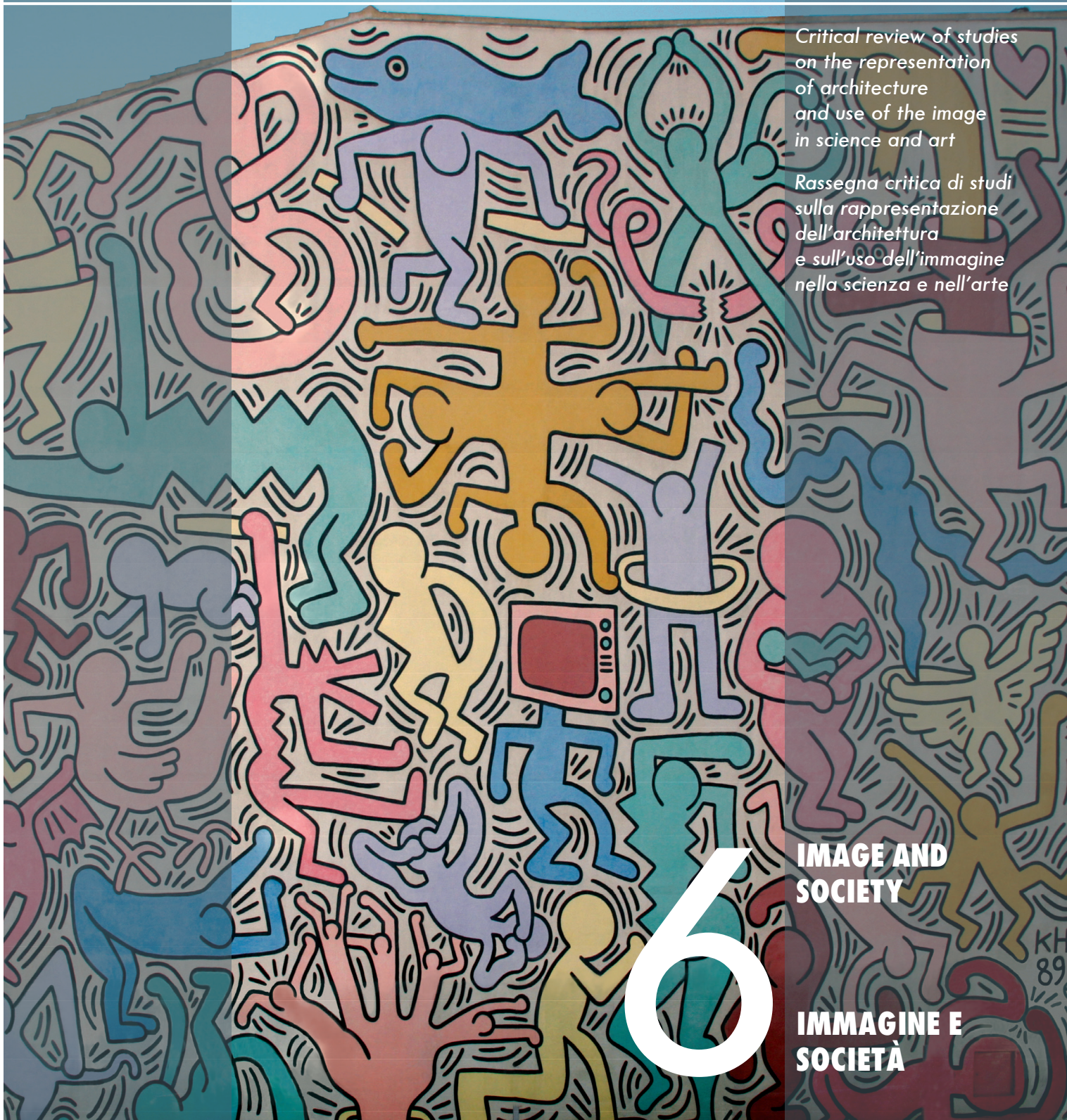
IMAGE AND SOCIETY

Rassegna critica di studi sulla rappresentazione dell'architettura e sull'uso dell'immagine nella scienza e nell'arte