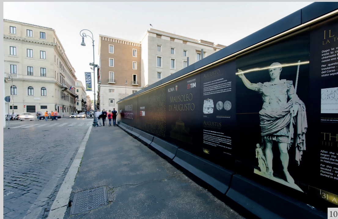
Figure 10 Telecom Italia, Mausoleo di Augusto construction site , 2017, Rome. Audio installations, graphics, verbal and visual languages for site communication. Available at: https://www.artribune.com/arti-visive/archeologia-arte-antica/2017/05/archeologia-restauri-rinascita-mausoleo-augusto-roma/ [visited September 2, 2018].