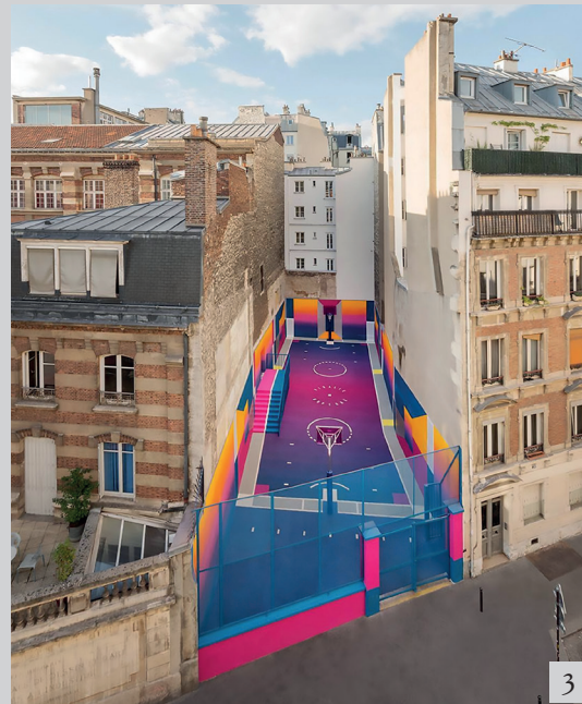
Figure 3 ILL–Studio, Le terrain de basket Duperré à Pigalle , 2009, Paris. An interstitial space resulting between two buildings, at first element of decay, becomes an aggregative space thanks to a graphic intervention. Available at: https://www.dezeen.com/2017/06/28/ill-studio-pigalle-nike-update-colourful-basketball-court-rue-duperre-paris-france-architecture-public-leisure/ [visited June 20, 2018].

Thanks to the growth of culture and the use of technology, this dynamic becomes a sort of engine for the cities’ growth, they invest in communities’ attracting elements to achieve the progress of the city and promote the quality of environmental life. Big or small events that are considered as largescale social gatherings for