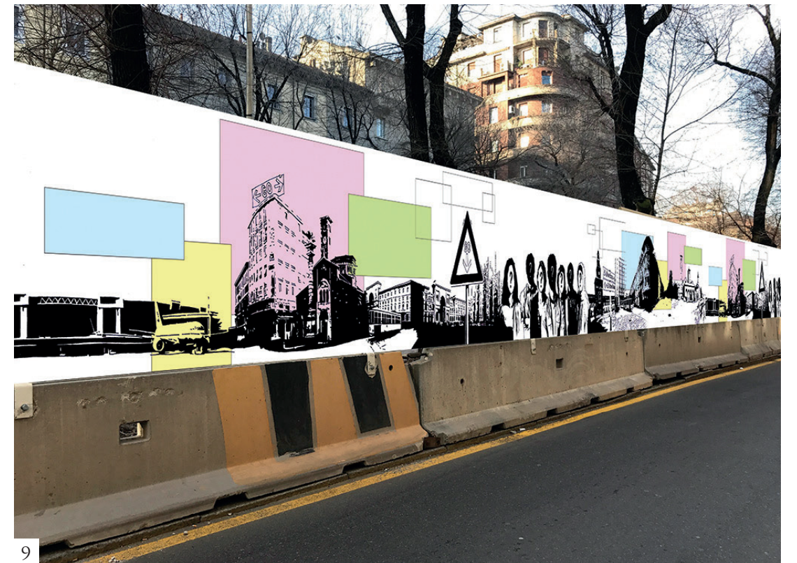
Figura 9 Alessandro Di Vicino, All Direction , 2017, Milano. Ipotesi progettuale per la vestizione di cesate di cantiere della linea metropolitana M4 a Milano. Le illustrazioni rappresentano il quartiere che si sviluppa intorno alla fermata metropolitana e forniscono indicazioni su come muoversi all'interno del quartiere stesso. Disponibile da: http://www.metro4milano.it/progetti_artistici/all-directions/ [visitato 3 novembre 2018].

con i fruitori sia degli spazi cittadini che con quelli finali del prodotto. I primi esempi possono essere ravvisati già nella vestizione dei ponteggi in particolare di quegli edifici la cui facciata è in fase di restauro, che per centralità, per storicità o per importanza hanno valore collettivo (fig. 8). Le immagini generalmente rappresentano l'edificio stesso nel suo stato post-restauro tramite fotoraddrizzamento del prospetto; se ancora non è possibile parlare di partecipazione, risulta evidente una volontà di valorizzare l'intera area di cantiere e di migliorare la percezione dello spazio cittadino. Un'evoluzione è visibile nei cantieri per la costruzione della linea metropolitana M4 a Milano, dove l'amministrazione ha sottolineato la necessità di trasformare il cantiere in un'occasione di pubblico interesse, ponendolo al centro di un progetto più esteso di comunicazione territoriale, utilizzando le cesate come uno strumento di informazione sulle lavorazioni in corso e rendendo i cittadini attivi nella realizzazione delle immagini stesse. Per i cantieri sono state previste tre forme di allestimento: una dedicata alla comunicazione istituzionale,