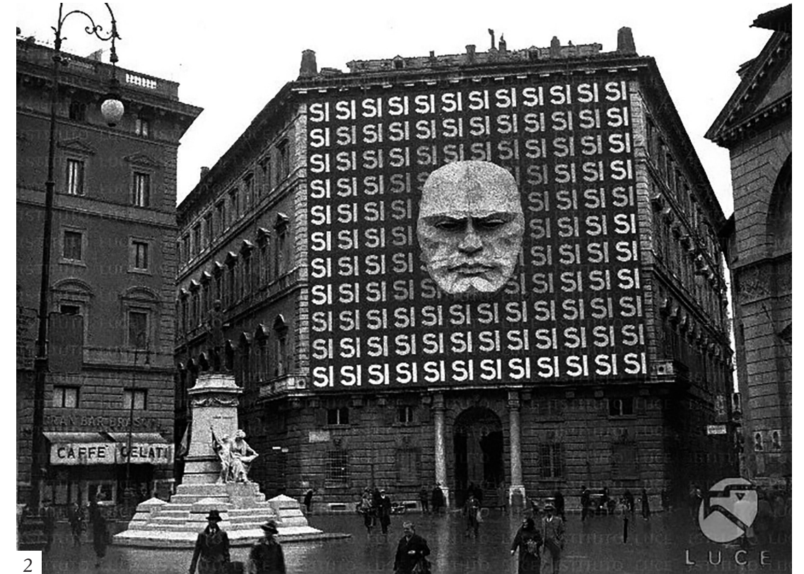
Figura 2 Rivestimento pubblicitario di palazzo Braschi a Roma durante il plebiscito del 1934.

semplicemente il risultato dei singoli interventi, tantomeno la sommatoria dei numerosi allestimenti con elementi di arredo urbano o di accorgimenti prospettici ed illusori, piuttosto consiste nella percezione della spazialità urbana che ne scaturisce. Gli interventi urbanistici della Roma papale, iniziati con Sisto V, mirano, attraverso una sapiente manipolazione degli indizi semantici, a stabilire il potere della Chiesa sulla città.