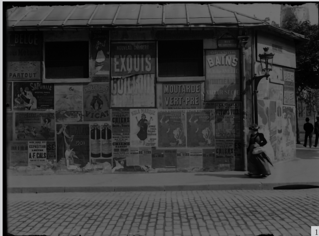
Figure 1 Advertising posters in Paris, image from the end of the 19th century.