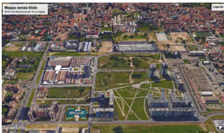
Figura 3 | Quartiere Adriano: vista a volo d'uccello dell'ex comparto Magneti Marelli con il parco ed il masterplan incompiuto

e per il tempo libero (22mila mq): asilo nido (1800 mq.), scuola materna, centro polifunzionale a prevalente carattere sportivo, residenza universitaria e per anziani. Di particolare rilevanza il centro sportivo attrezzato (3700 mq) che avrà, oltre alla piscina, palestre e luoghi dedicati a manifestazioni e spettacoli. Dei complessivi 500mila mq, comprensivi del recupero della Cascina San Giuseppe, circa 306mila erano di competenza di due società: Aedes e Gefim (area Marelli – Adriano). Il quartiere, con l'impulso della bolla immobiliare di quegli anni, parte alla grande ma nel 2008 irrompe la crisi economica globale che rapidamente inizia a mietere le sue vittime locali: gli sviluppatori crollano per difficoltà legate al grosso indebitamento verso vari enti di credito. Vista la contrazione generale delle vendite i cantieri degli altri edifici non ancora avviati vengono congelati, insieme al sogno di un quartiere ideale immerso nella natura.