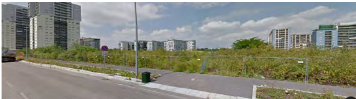
Figura 4 | Quartiere Adriano: visuale degli spazi residuali dalla via Vittorio Gassman. Sullo sfondo la rarefazione delle torri residenziali.

Il tema dell'incompiuto e del "non-finito" che connota l'iter progettuale della trasformazione del quartiere Adriano, permea ed inficia ovviamente la qualità del suo spazio pubblico, in attesa delle strategie di rigenerazione urbana delle Periferie promosse dal Comune. Ma qual'era l'idea iniziale di common ground della proposta iniziale? Il masterplan approvato dello studio CaputoPartnership (2004-2006), basava i suoi elementi essenziali nel rapporto spaziale e funzionale con Via Adriano e con il vasto parco centrale.