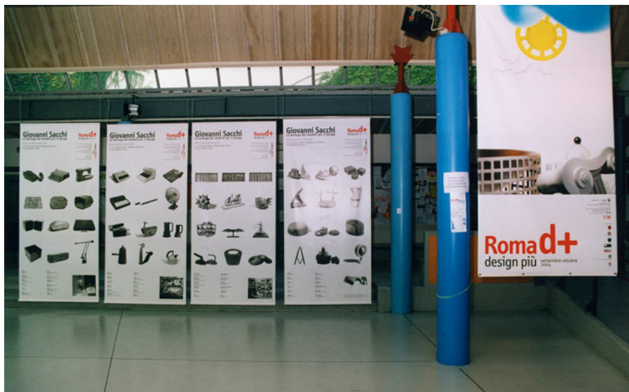
Fig. 1. Seconda edizione di Roma "design più" (2004, "Design is everywhere"): protagonista il design da quello dei giovani under 35 anni, a quello entrato nelle nostre case attraverso il "Carosello" e le Esposizioni Internazionali da rivivere nei documenti storici inediti ritrovati negli archivi dell'Istituto Luce o attraverso gli straordinari modellini in legno della Bottega di Giovanni Sacchi.

gn"(2006), "Made in Italy from Rome to Lazio" (2007), "DAS_ Designer After School" (2008), "DAS Europe_ Designer After School EUropean Creativity" (2009), "Il design degli effetti speciali" (2010-11).