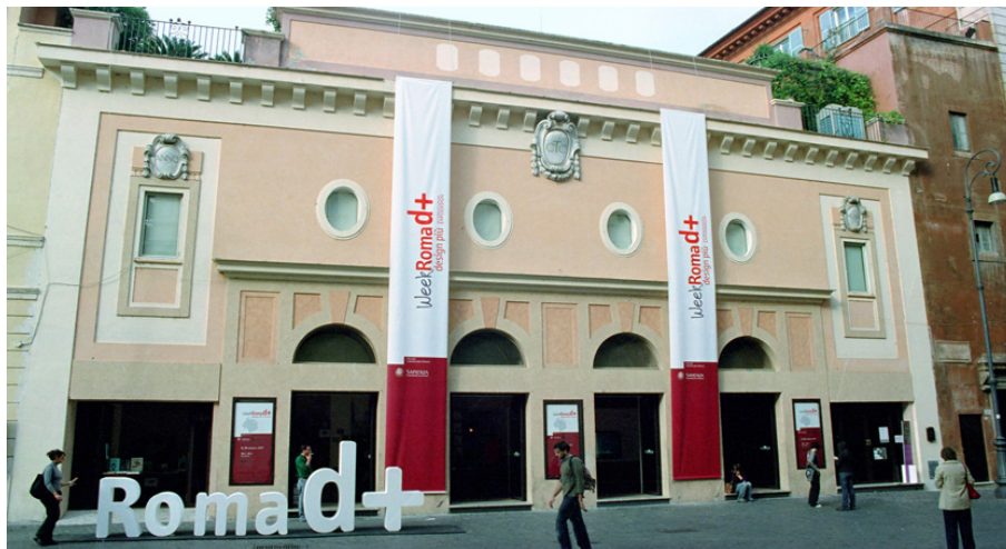
Fig. 7. L'edizione del 2007 di Roma design più "Made in Italy from Rome to Lazio", si svolge nell'imponente Spazio Etoile nel cuore di Roma. Tra le varie mostre quella curata da Carlo Martino sulle aziende del territorio laziale.

Proprio in questa edizione, il progetto di diffusione della cultura del design nelle maglie della città - con l'obiettivo di costruire una coscienza della cultura