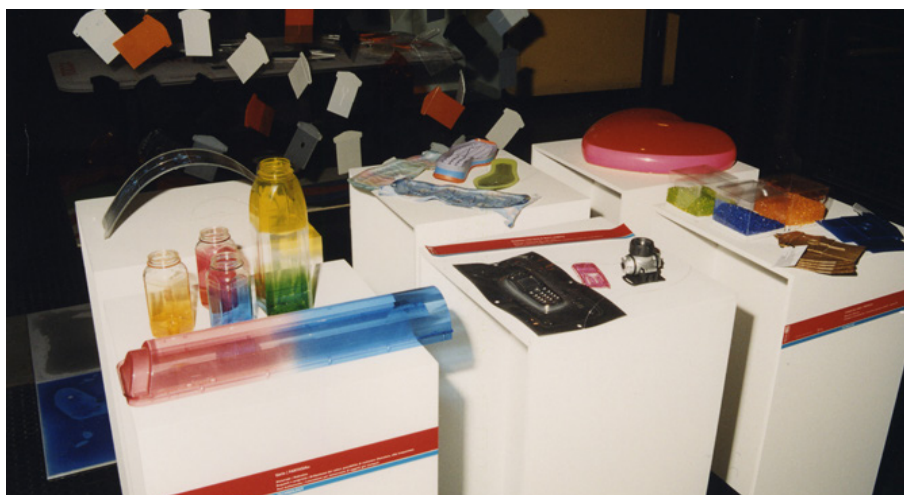
Fig. 6. Karim Rashid, eclettico designer del panorama internazionale è uno dei principali protagonisti dell'edizione 2006 di «Rd+».