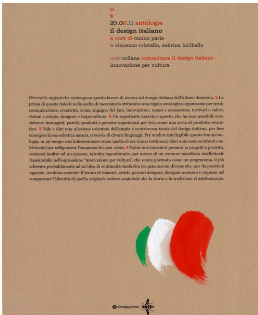
Fig. 17. Paris, A. con Cristallo, V. e Lucibello, S. (a cura di), Antologia del design italiano 20.00.11, collana "Comunicare il design italiano: Innovazione per cultura" . Roma 2012.

Diverse le ragioni che sostengono questo lavoro di ricerca sul design italiano dell'ultimo decennio. 1 La prima di queste risiede nella scelta di raccontarlo attraverso una regola antologica organizzata per temi: comunicazione, creatività, icone, ingegno del fare, innovazione, musei e conoscenza, territori e valori, visioni e utopie, designer e imprenditore. 2 Un espediente narrativo questo, che ha reso possibile considerare immagini, parole, prodotti e persone organizzati per tesi, come una sorta di prodotto estrattivo. 3 Vale a dire una selezione orientata dell'ampia e controversa teoria del design italiano, per fare emergere la sua eclettica natura, crocevia di diversi linguaggi. Per rendere intellegibile questa fenomenologia, in un tempo così indeterminato come quello di cui siamo testimoni, dieci anni sono sembrati emblematici per raffigurarne l'ampiezza dei suoi valori. 4 Valori non transitori presenti in progetti e prodotti, connessi inoltre ad un passato, talvolta ingombrante, per mezzo di un comune manifesto intellettuale riassumibile nell'espressione "innovazione per cultura", che suona piuttosto come un programma, il più aderente probabilmente ad un'idea di continuità simbolica tra generazioni diverse che, pur da posizioni opposte, rendono coerente il lavoro di maestri, artisti, giovani designer, designer anonimi e imprese nel comprovare l'identità di quella originale cultura materiale che la storia e la tradizione ci attribuiscono.