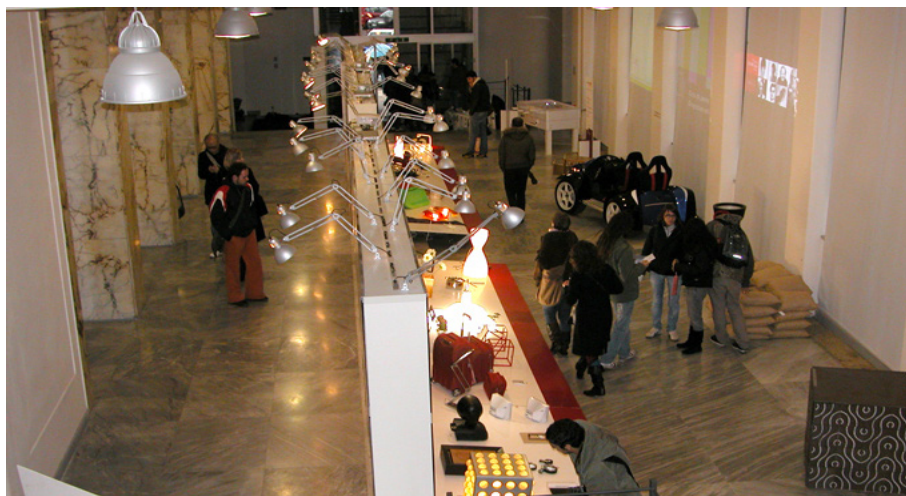
Figg. 9, 10. L'edizione del 2008 "DAS_Designer After School", è dedicata ad indagare la nuova generazione di designer che vengono formati nelle Scuole di Design italiane (mostra a cura di Loredana di Lucchio e Lorenzo Imbesi).