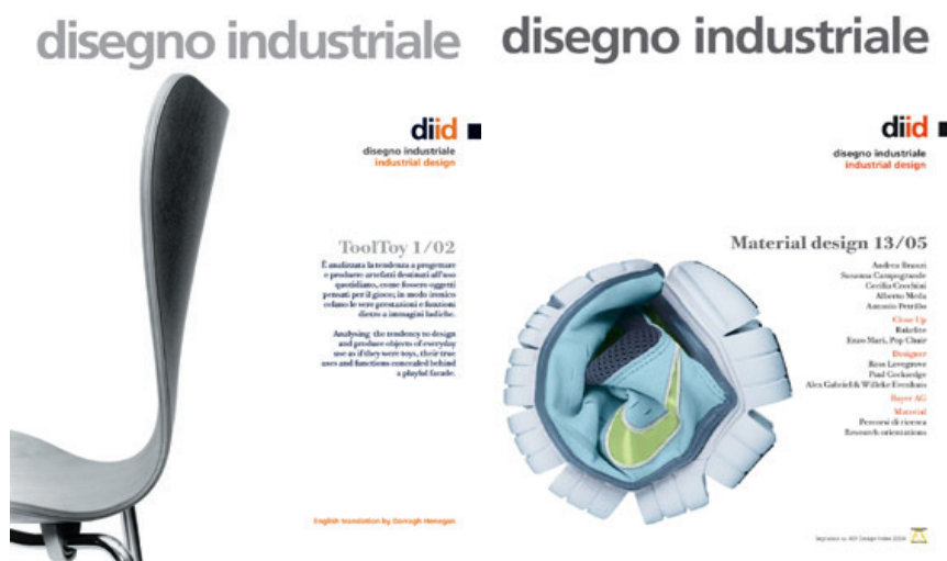
Fig. 16. Il numero 13/05 «Material Design», offre una panoramica sulla sperimentazione progettuale letta attraverso le potenzialità offerte dai nuovi materiali, ma anche dall'uso innovativo di prodotti tradizionali.