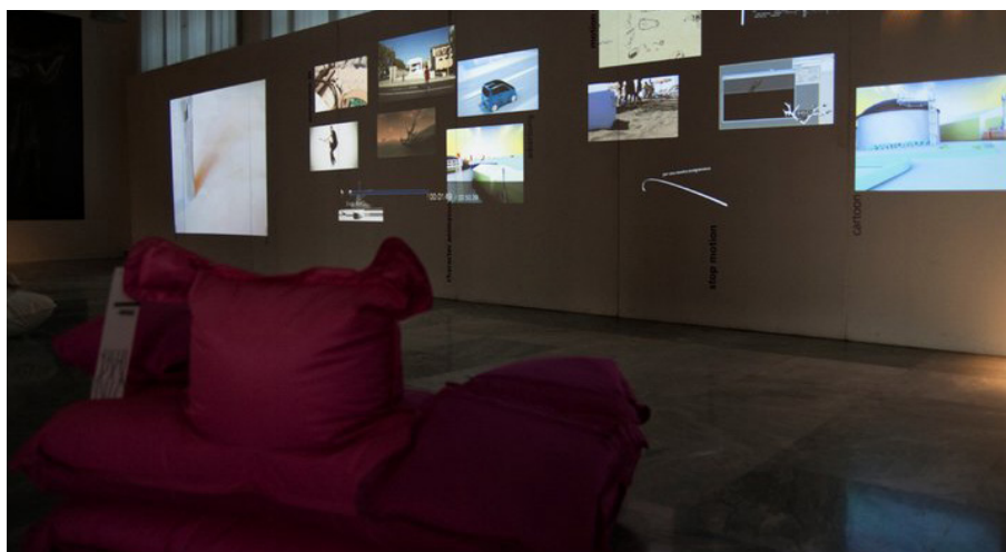
Figg. 13, 14. L'ultima edizione di «Rd+» è dedicata ad indagare le potenzialità derivanti dalla conoscenza e dall'uso dei nuovi strumenti multimediali e tecnologici, in virtù delle nascenti applicazioni nella modellazione, nella prototipazione, nel reverse engineering.