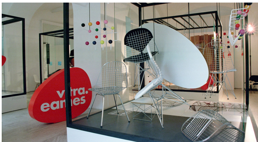
Fig. 8. L'edizione del 2007 di Roma design più, è dedicata a rappresentare un design altro: da quello dell'industria aeronautica a quello anonimo.