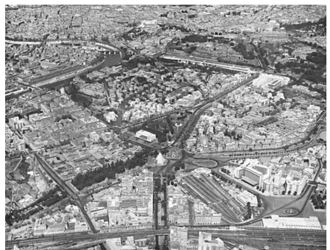
Fig. 1. Aerofoto dei Rioni Testaccio, San Saba e Ripa (4 maggio 1961), Istituto Centrale per il Catalogo e la Documentazione Aerofototeca Nazionale, Fotocielo, neg. 13.388.

Entro questo ambito di studio il contributo monografico ha inteso operare una rilettura del "verde" che «dai fianchi dell'Aventino scende fino alla Piramide Cestia e poi raggiunge il Monte Testaccio». L'analisi parte da alcune considerazioni generali sulla politica del verde a Roma negli anni del Governatorato, per poi affrontare nello specifico la formula-