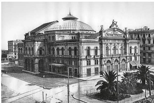
Fig. 1. Bari, Teatro Petruzzelli. Veduta di insieme dell'edificio con il prospetto laterale ancora incompiuto, primi anni del Novecento.