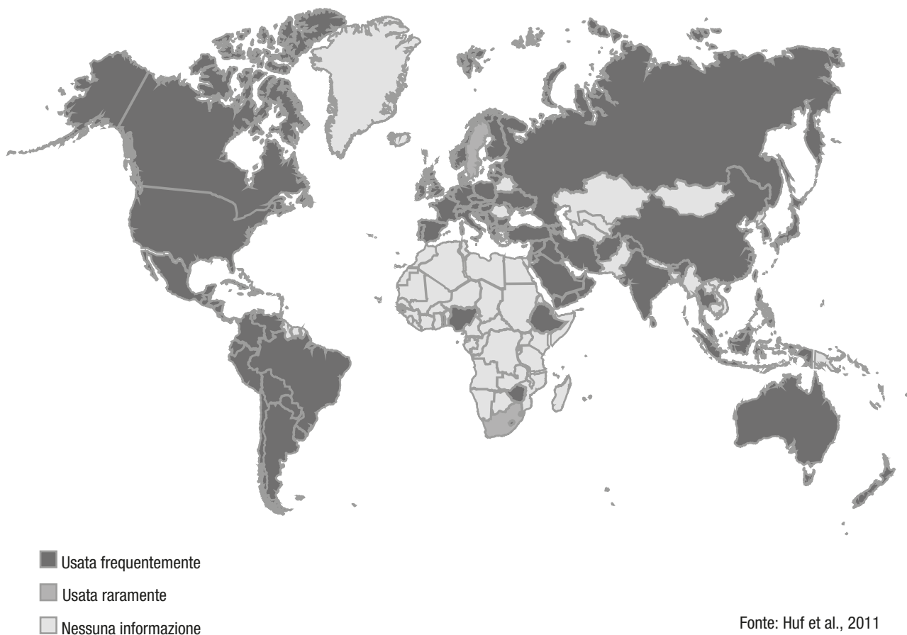
Fig. 2.1 – Diffusione geografica delle pratiche di contenzione