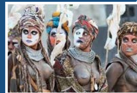
Greek civilization, 5th centu

a cosa serve? L'Europa chi è? Che mondo vuole? Il mondo dei fili spinati? Della gente che muore annegata nel mare? E invece no, si chiacchiera, si va a Bruxelles, si fanno gli incontri, c'è un'aria soft. Qui non c'è niente di soft nella vita, la vita è uno schianto. Ecco, io trovo che tutto questo derivi dal fiume di falsa coscienza e retorica che ammantano la vera responsabilità. L'Europa c'è o non c'è? E allora se