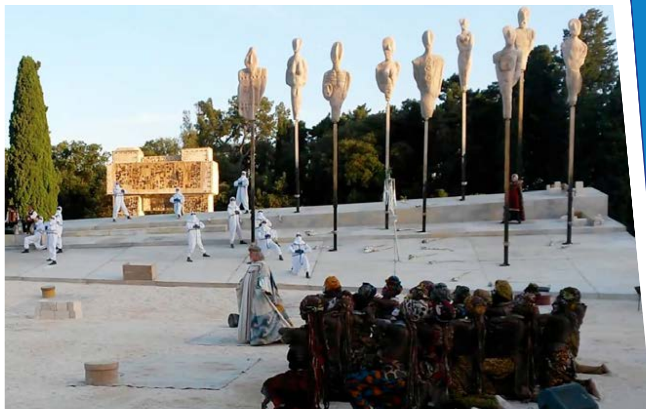
Moni Ovadia. World Refugee Day.

MO: From the point of view of the history of human relations the Mediterranean should be a meeting place and not of a point of collision. The greatest civilizations have formed on the Mediterranean. It is natural to meet, to learn, to give, to take, to exchange, to build and to create melting pot of people. Mediterranean should have, due to its nature, the role to join because it is a sea full of movements and therefore of trade, of diffusion of knowledge and of arts. Then conflicts arrive, but have conflicts real reasons? No, conflicts have reasons of power, always and only reasons of power. Men have interest in meeting each other and exchanging information, knowledge