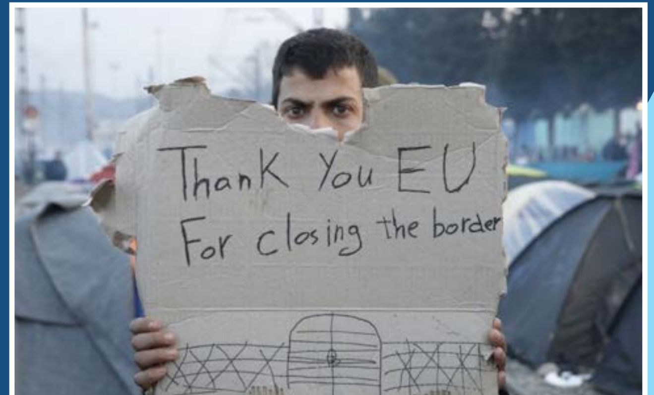
Turkey - refugees

The importance of Turkey in managing Syrian refugees is current political chronicle. Besides the recent agreement among member states and Turkey to contain the passage of refugees to Europe, UNHCR renewed the Regional Refugee and Resilience Plan to ensure humanitarian protection and help refugees to integrate themselves in the hosting country. In this frame, too, Turkey is considered the leader country for confronting the emergency: