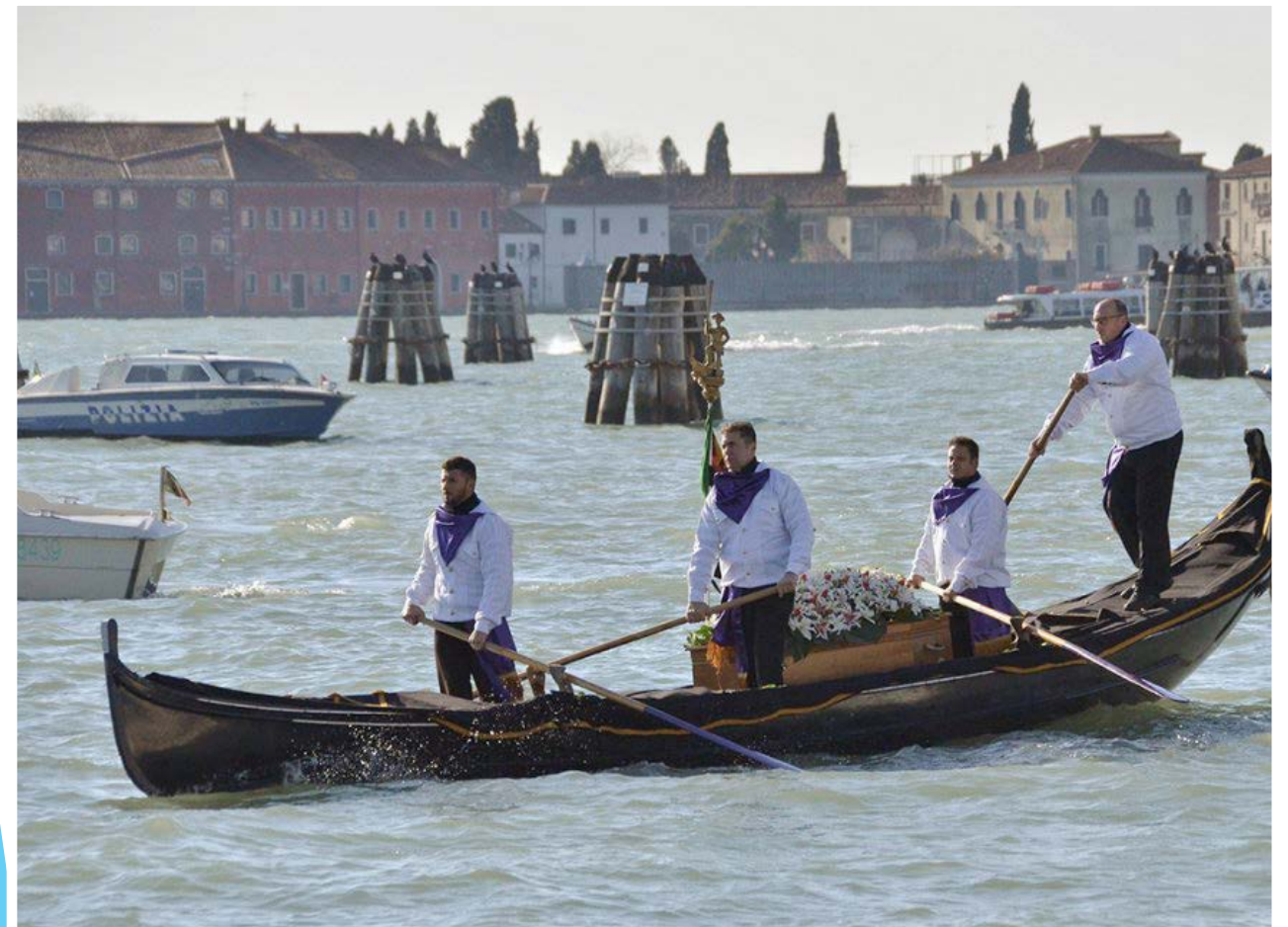
Venice- Valeria Solesin funeral

e grande varietà interna. Vale la pena di conoscere, prima di giudicare. Non date orecchio a colui il cui cuore è pieno di odio e la cui testa è programmata per mistificare la verità. I versi del Corano devono essere interpretati solo all'interno del proprio contesto e non in maniera separata. Non vi sono nel Corano versi che invitano a uccidere o a terrorizzare i cristiani e gli innocenti. Basti citarne uno in cui Dio dice: 'Coloro che credono, e i giudei e i sabei e i cristiani, quelli che credono in Dio e nell'Ultimo Giorno e che operano il bene, nulla essi hanno da temere e non saranno attristati' (Corano V:69).