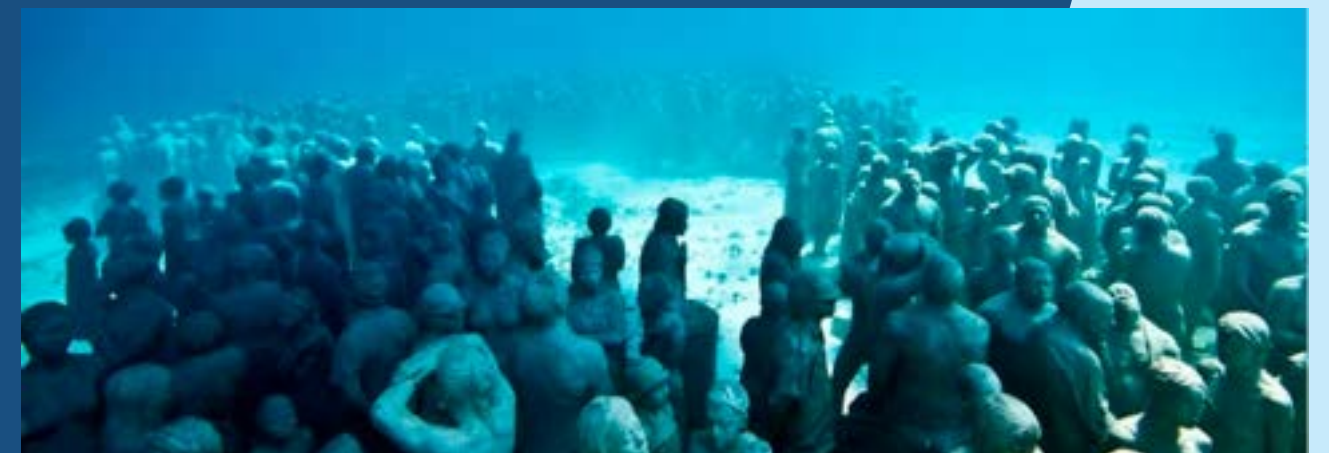
Cancun, subaquatic museum