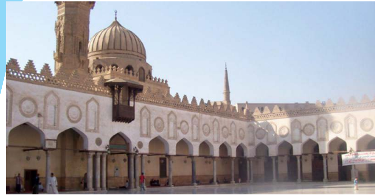
Al-Azhar University- Egypt

Tale strumento ha come fine la liberazione delle popolazioni dalla "tirannia dell'uomo sull'uomo", dovuta all'idolatria, con un chiaro riferimento, all'inizio, a Nasser e alla sua politica. Deve quindi inoltre essere ripresa la da'wa (predicazione) islamica, per poter mostrare la perfezione dell'ideologia islamica, incommensurabilmente superiore a tutte le altre ideologie umane.