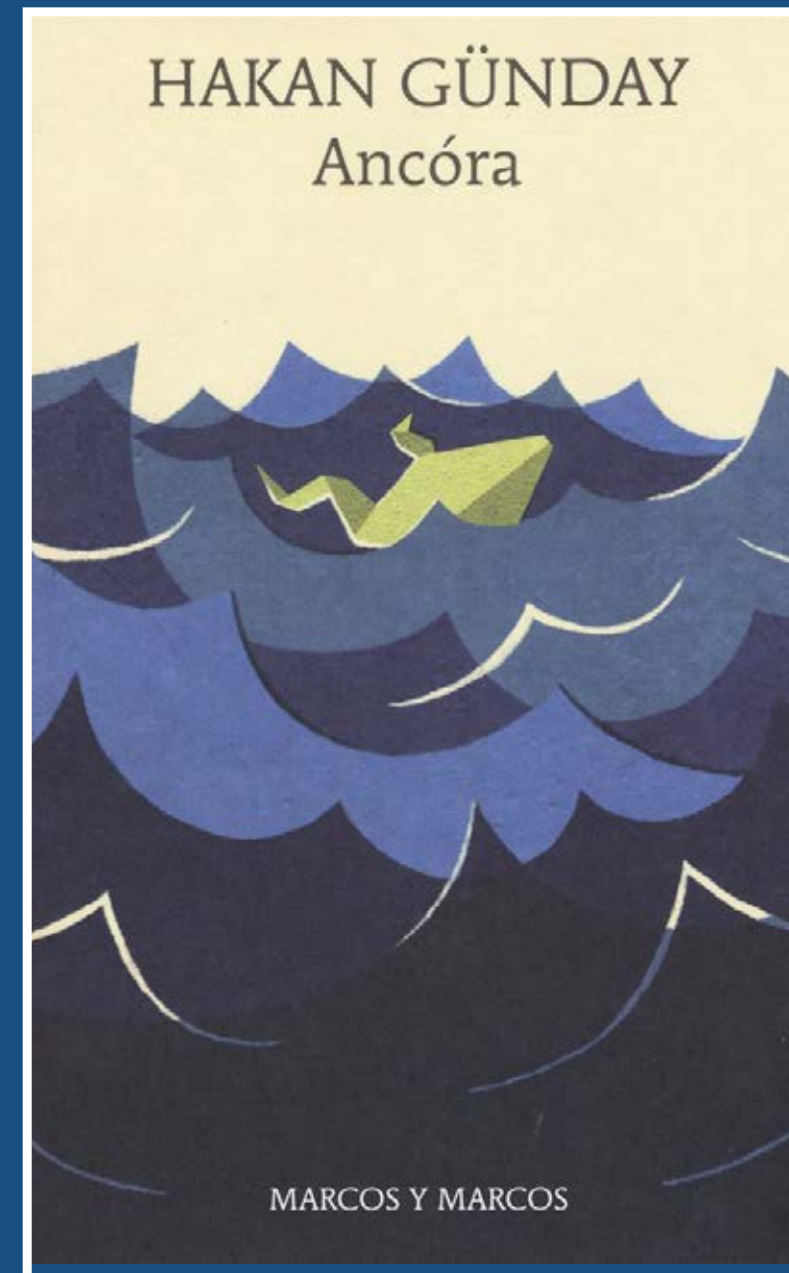
Hakan Gunday, scrittore

“Gazâ”. “Dimmi, papà”. “Hai sentito anche tu? Qualcuno ha urlato un attimo fa?” “No, papà”. “Mi era sembrato. Comunque...” “Comunque...” Stavo ancora mentendo. Certo che avevo sentito quel grido, ma non erano passati neanche due giorni da quando avevo scoperto che quel pezzo di carne che spuntava dal mio inguine non serviva solo a pisciare. Di conseguenza non desideravo altro che sbrigare in fretta i nostri affari per andare a chiudermi a chiave nella mia stanza. Nel vano di carico del nostro camion in movimento erano stipati ventidue adulti e un neonato. Come potevo sapere che quel grido soffocato proveniva da una madre disperata che si era accorta della morte del figlio che teneva in braccio? Forse gli altri le avevano tappato la bocca, spaventati? E anche se lo avessi saputo, avrebbe fatto differenza? Non credo proprio, perché ormai avevo undici anni.