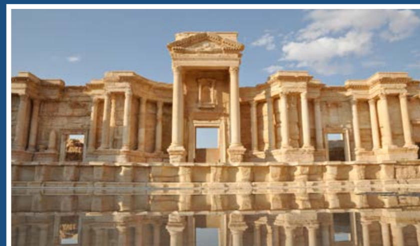
Palmyra – Roman Theatre

così che deve essere per il futuro. Pace e accoglienza.