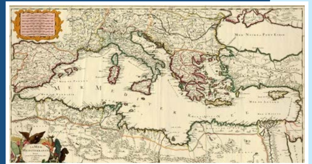
Mediterranean- Map of the XVIII century