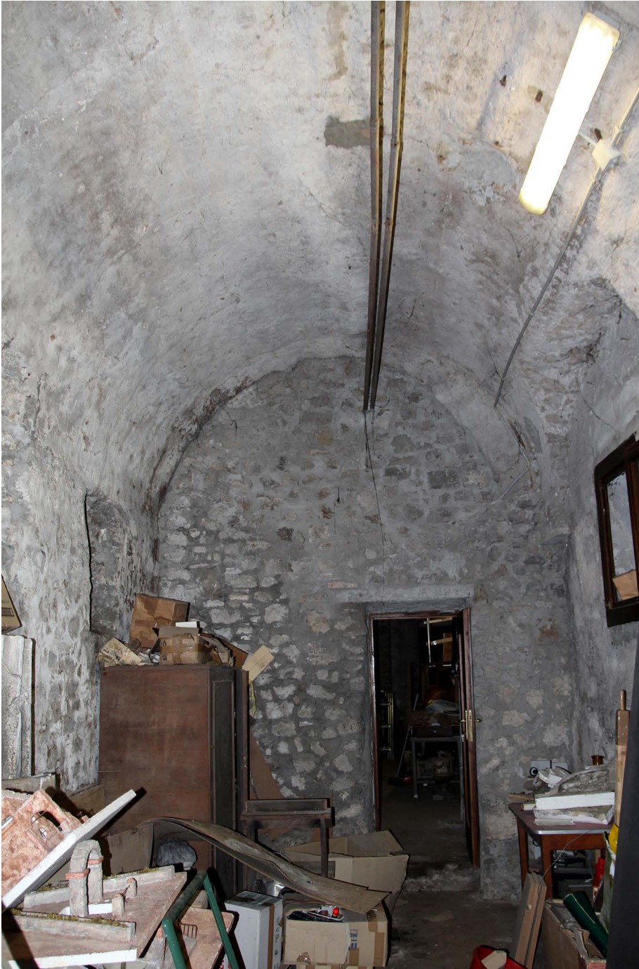
Fig. 5. Roma, San Lorenzo fuori le Mura, ala est, ambiente al pianterreno.