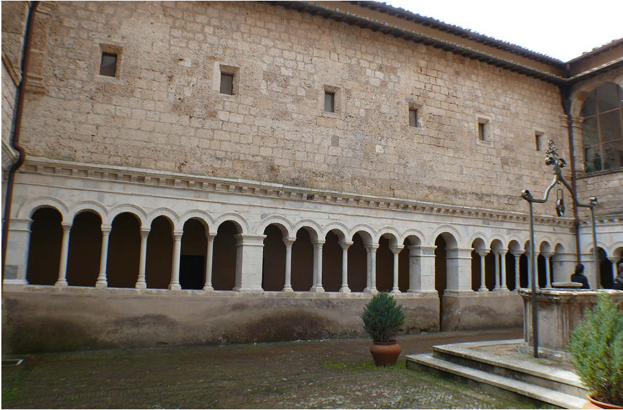
Fig. 8. Subiaco, Santa Scolastica, chiostro, galleria sud.