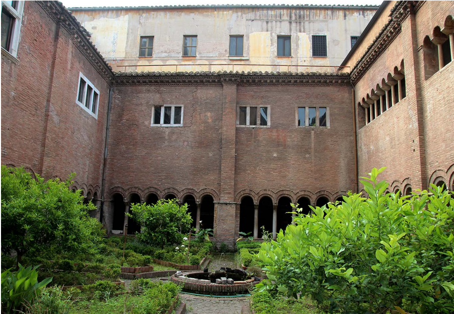
Fig. 3. Roma, San Lorenzo fuori le Mura, chiostro.