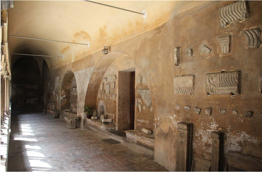
Fig. 10. Roma, Santi Quattro Coronati, chiostro, interno dell'ambulacro ovest.