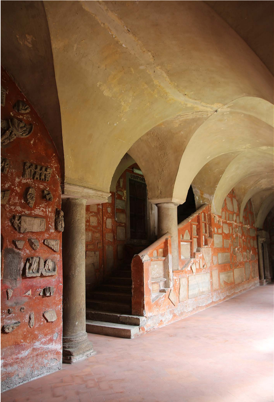
Fig. 4. Roma, San Lorenzo fuori le Mura, chiostro, scala nell'ala nord.