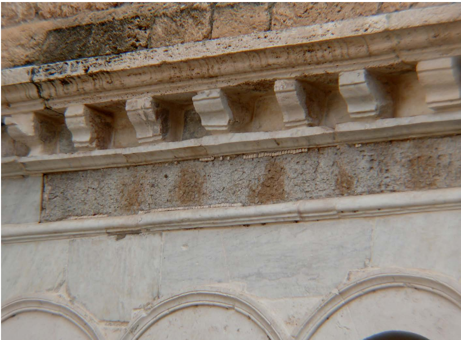
Fig. 9. Subiaco, Santa Scolastica, chiostro, galleria est, resti dell'iscrizione musiva.