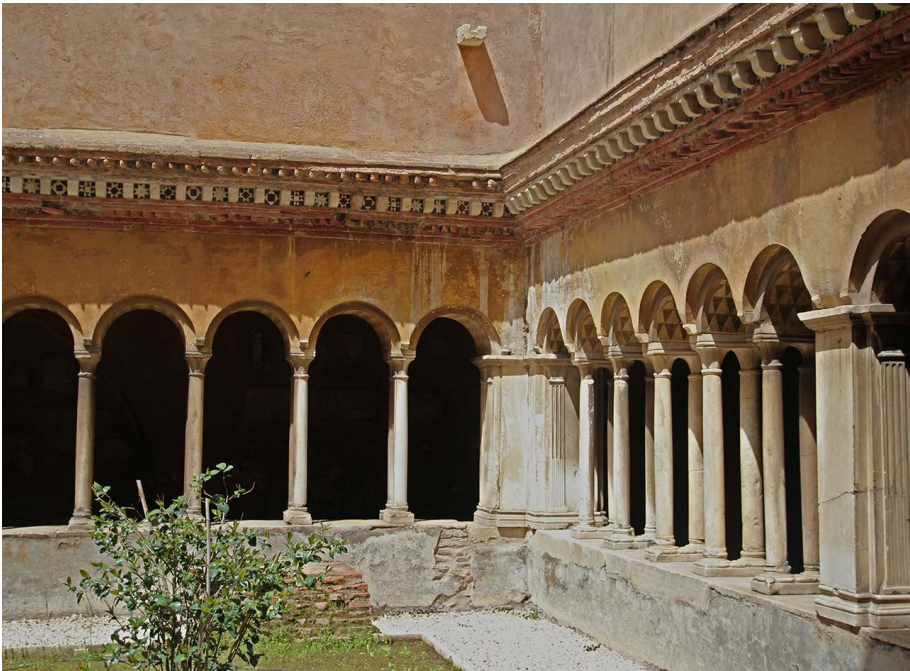
Fig. 11. Roma, Santi Quattro Coronati, chiostro.