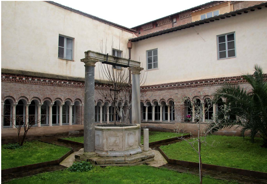
Fig. 6. Roma, Santa Cecilia in Trastevere, chiostro.