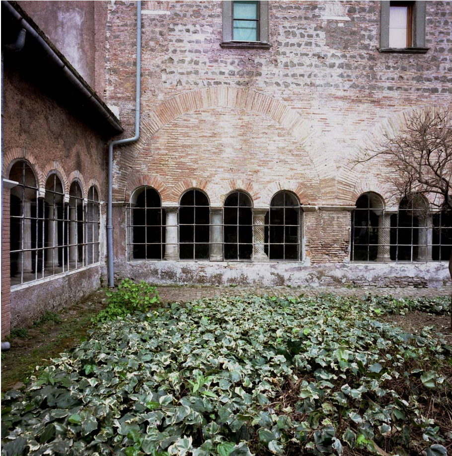
Fig. 1. Roma, Tre Fontane, chiostro, incrocio ali est e nord.