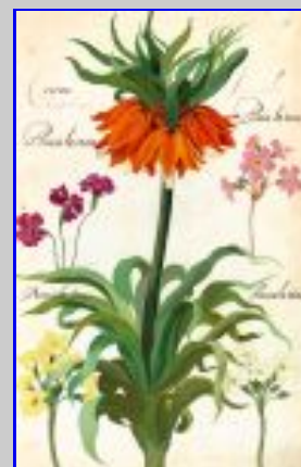
Fig. 2 Franciscus De Geest, Hortus Amoenissimus , copia facsimilare. Rappresentazione di diverse tipologie di fiori: la Primula