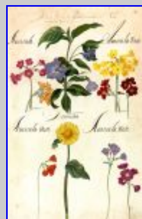
Fig. 3 Franciscus De Geest, Hortus Amoenissimus , copia facsimilare. Rappresentazione di diverse tipologie di