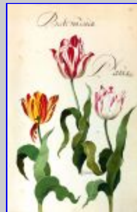
Fig. 1 Franciscus De Geest, Hortus Amoenissimus , copia facsimilare. Rappresentazione del Tulipano d'Oriente: il Semper Augustus