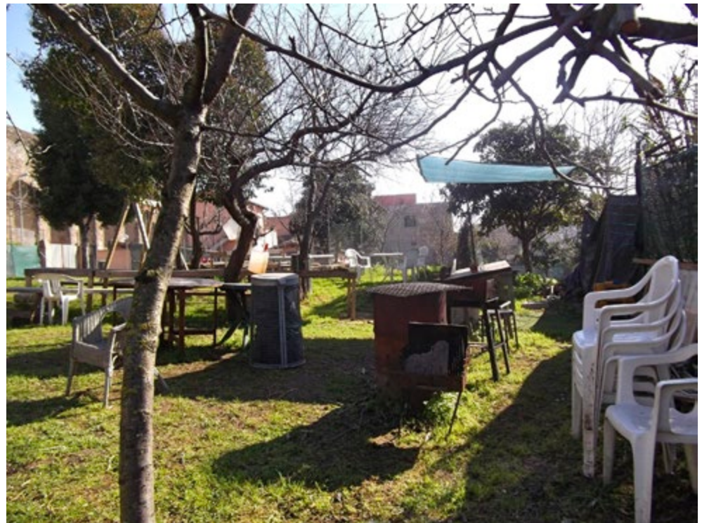
Fig. 2. Il Terreno di via del Mandrione / via Casilina Vecchia.

Se il numero di orti e giardini condivisi (che quindi possono rientrare nella categoria delle comunanze) è molto elevato, non è così per altri spazi urbani, come piazze e strade, dove è difficile trovare aree di comunanza per difficoltà nella delimitazione degli spazi e a causa del traffico. Un esempio in questo senso è quello di via del Teatro Valle,