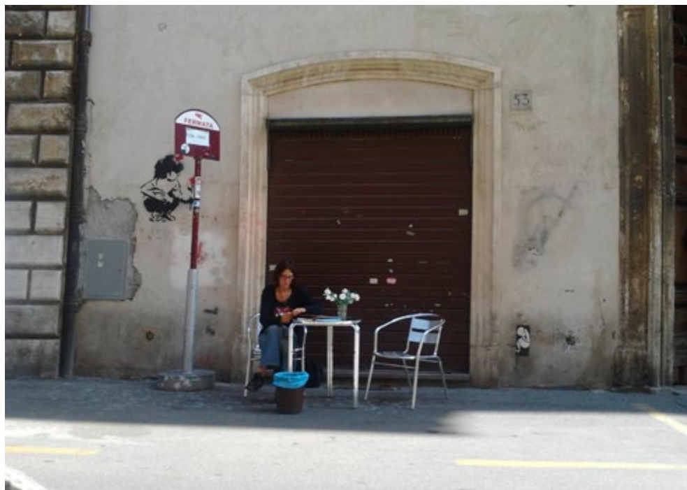
Fig. 3. Via del Teatro Valle con tavoli e sedia lasciati dagli occupanti.

Altre comunanze potrebbero essere ritrovate in spazi (verdi e non) che fanno da esterno a un edificio condiviso: questi sono luoghi di comunicazione, di incontro e di apertura, uno spazio di unione significativa tra interno ed esterno. Altre ancora possono essere rappresentate da spazi comuni in insediamenti autocostruiti o spazi abitativi gestiti in comune (ad esempio il co-housing ) che abbiano dei luoghi di socialità aperti all'esterno. Essendo le comunanze basate sulla possibilità di uso e avendo tutte un carattere temporaneo, benché protratto nel tempo, vale la pena accennare nell'elenco anche a quelle azioni di riappropriazione breve di uno spazio, che rientrano nel campo della possibilità e della rivendicazione di usi diversi dell'urbano, più che in un processo di messa in comune e costruzione con tempi lunghi (comunanze temporanee). Tra queste il Guerrilla Gardening o gli SLURP , 7 così come i luoghi prodotti nei momenti di uso politico dello spazio in forma assembleare e orizzontale: per citare un esempio, le accampate degli Indignati spagnoli.