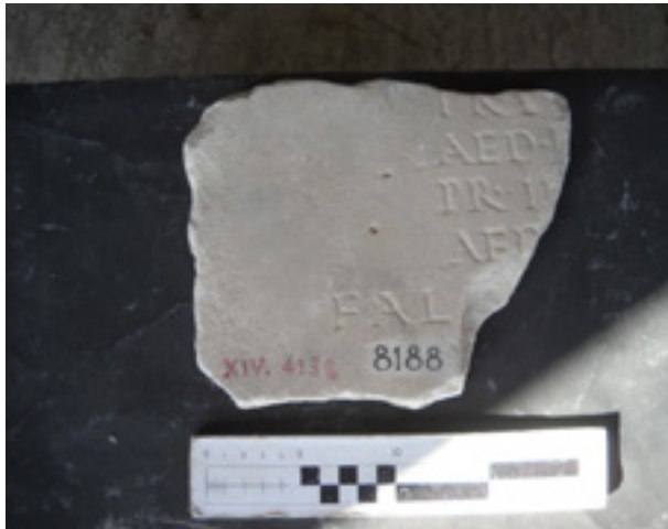
Fig. 3 - Ostia, deposito 20, inv. 8188: frammento della lastra con i fasti degli edili e dei pretori di Vulcano degli anni 192-193 d.C. CIL , XIV 4138, Concessione Soprintendenza speciale per i beni archeologici di Roma.