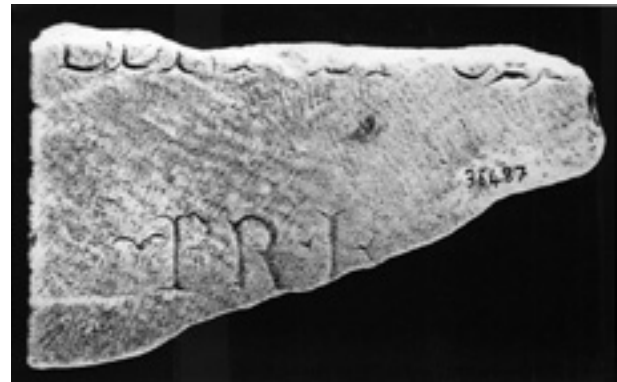
Fig. 6 - Ostia, dalla Basilica di Pianabella, deposito 20, inv. 36487: frammento di lastra con i fasti degli edili e dei pretori di Vulcano di anno incerto. AE 2001, 634 e, Concessione Soprintendenza speciale per i beni archeologici di Roma.

La recente pubblicazione di alcune iscrizioni provenienti da Pianabella ha fatto conoscere altri sette frammenti, cinque dei quali, contigui, si riferiscono agli anni 245-247 d.C., mentre gli altri due non sono databili con precisione 20 (figg. 4-6).