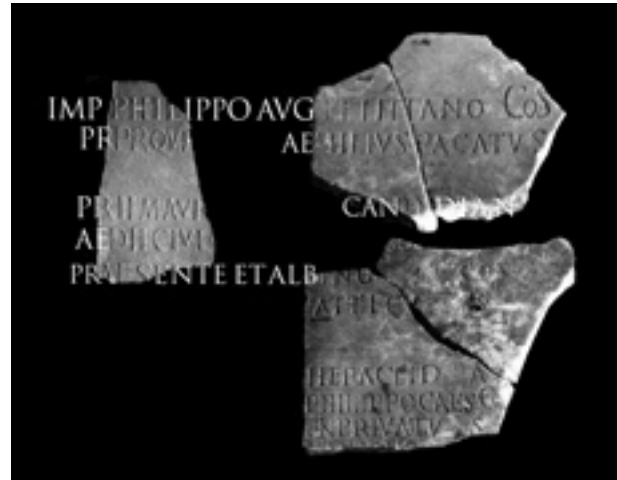
Fig. 4 - Ostia, dalla Basilica di Pianabella, invv. 48909, 47817, 47799 + 47898 (irreperibili): frammenti della lastra con i fasti degli edili e dei pretori di Vulcano degli anni 245-247 d.C. AE 2001, 634 a-c