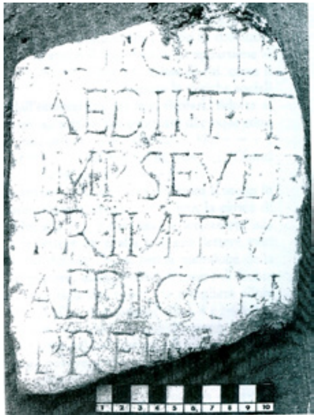
Fig. 2 - Villa privata a Punta Zancale presso Marina di Camerota (SA): frammento della lastra con i fasti degli edili e dei pretori di Vulcano degli anni 222-229 d.C. Da Mennella 1995, p. 96.