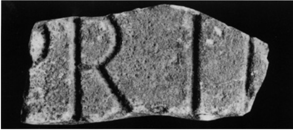
Fig. 8 – Ostia, dalla Basilica di Pianabella, inv. 48931 (irreperibile): frammento di lastra con i fasti degli edili e dei pretori di Vulcano di anno incerto.

Nuzzo 1999, p. 40 n° A6, Concessione Soprintendenza speciale per i beni archeologici di Roma.