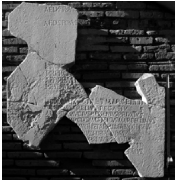
Fig. 1 - Ostia, via Tecta, inv. 6354: frammenti della lastra con i fasti degli edili e dei pretori di Vulcano degli anni 272-276 d.C. Da Licordari 1984, p. 347-349, Concessione Soprintendenza speciale per i beni archeologici di Roma.

Alcuni anni più tardi, G. Mennella ha riconosciuto in un frammento murato in una villa privata a Punta Zancale presso Marina di Camerota (SA) un'ulteriore porzione di elenco relativa agli anni 222-229 d.C. 18 (fig. 2) ed ha ricongiunto alla serie un trascurato frammento, già edito in CIL , XIV, che Dessau, senza seguito, aveva correttamente attribuito al collegio di Vulcano: Mennella, oltre a migliorarne la lettura, lo ha ricondotto agli anni 192-193 d.C. 19 (fig. 3).