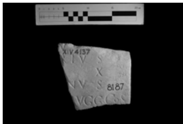
Fig. 7 - Ostia, deposito 20, inv. 8187: frammento di lastra forse relativo ai fasti degli edili e dei pretori di Vulcano di anno incerto. CIL , XIV 4137, Concessione Soprintendenza speciale per i beni archeologici di Roma.