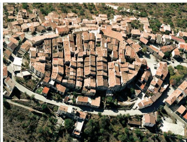
Fig. 1. A sinistra un esempio di aggregato dell'abitato di Onna (L'Aquila) gravemente danneggiato dal sisma del 2009; a destra una vista dall'alto del borgo di Castelvechio Calvisio (L'Aquila) poco danneggiato dal terremoto aquilano.