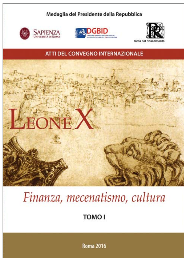
Fig. 1. Sovraccoperta del volume a cura di Flavia Cantatore et al. Leone X: finanza, mecenatismo, cultura . Roma: Edisegno 2016.

Il titolo del convegno individua le linee intorno alle quali si è articolata la ricerca. Con l'elezione del cardinale Giovanni de' Medici diveniva pontefice l'esponente di una delle principali famiglie di banchieri del tempo e si determinava un forte legame politico-culturale tra Roma e Firenze. Nello stesso tempo la politica di Leone X, figlio di Lorenzo il Magnifico, è stata decisamente caratterizzata da imprese di committenza e mecenatismo di notevole pregio. Tali imprese sono state realizzate potendo contare non solo sulle en-