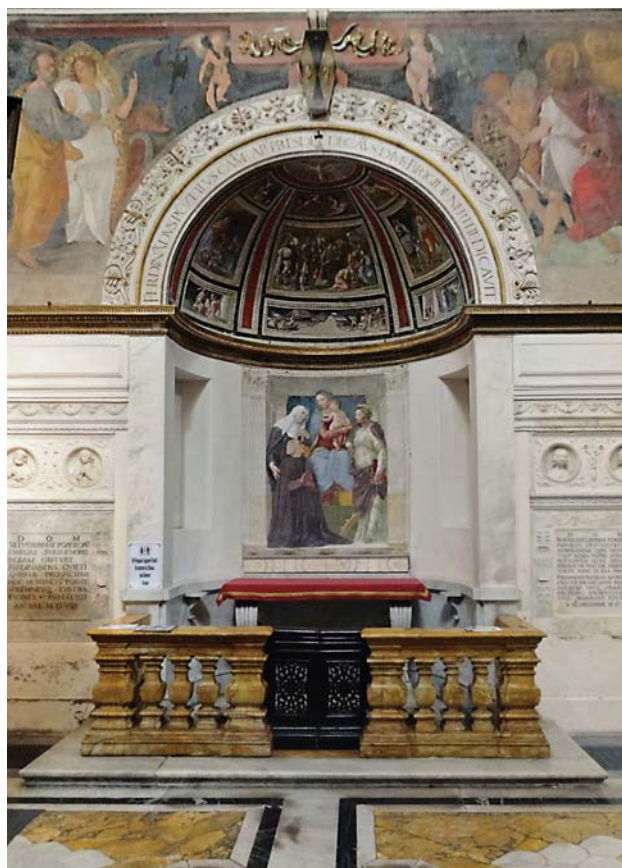
Fig. 3. Roma, Santa Maria della Pace, Cappella Ponzetti.

trate ecclesiastiche ma anche sul rapporto privilegiato con le grandi banche: Altoviti, Gaddi, Ricasoli, Bini, Della Casa, Rucellai, Strozzi, Sauli. Il convegno è perciò nato dal proposito di analizzare le complesse dinamiche economiche che caratterizzarono il pontificato leonino e quindi l'imponente sforzo di promozione culturale e artistica a cui esse in parte diedero luogo.