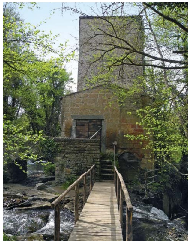
Fig. 1. Mazzano Romano. Mola di Monte Gelato, veduta da est. Il mulino, risalente ai primi decenni dell'Ottocento, fu costruito all'interno di una torre medievale, in corrispondenza fiume Treja (M. Docci, 2014).

questo tipo di edifici sia strettamente legato da un lato al lavoro dell'uomo e alla cultura dei luoghi, dall'altro alla presenza delle risorse naturali, l'acqua nello specifico, necessarie al loro funzionamento. In questo senso l'analisi che si è portata