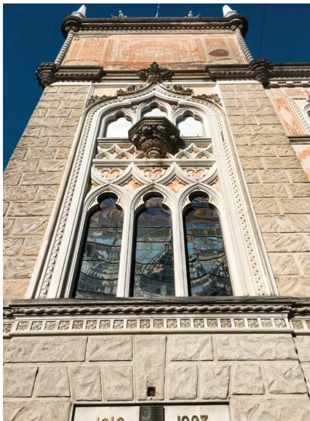
Fig. 2. Gaetano Moretti, dettaglio della torre del Circolo canottieri italiani al Tigre (Argentina).

di Belle Arti a Lima, monumento per il Centenario a Buenos Aires, monumento alla bandiera argentina a Rosario), oltre a edifici che segnano il suo vincolo con le comunità italiane in questi paesi.