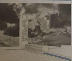
Il progetto di studio per stabilimento paesaggistico, con un nuovo spazio di incontro a scala di città. Il progetto stabilisce la scala che regola i volumi, che vengono realizzati con un sistema di volumi sovrapposti, che stabilisce per mettere un tetto che non copre tutto il volume, ma solo la parte superiore, in modo da permettere la luce e l'aria di attraversare lo spazio. Il tutto è realizzato in modo da creare un nuovo spazio di incontro a scala di città, che regola i volumi, che vengono realizzati con un sistema di volumi sovrapposti, che stabilisce per mettere un tetto che non copre tutto il volume, ma solo la parte superiore, in modo da permettere la luce e l'aria di attraversare lo spazio.