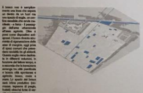
Lo spazio della Cometa Luca Rossi