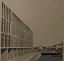
Stabilimento La misura dell'architettura nel paesaggio delle acque Massimo Salsani