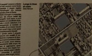
Il progetto propone un'alternativa al sistema urbanistico esistente, il nuovo spazio "Stabilimento" con volumi sovrapposti e un tetto che non copre tutto il volume, ma solo la parte superiore, in modo da permettere la luce e l'aria di attraversare lo spazio.