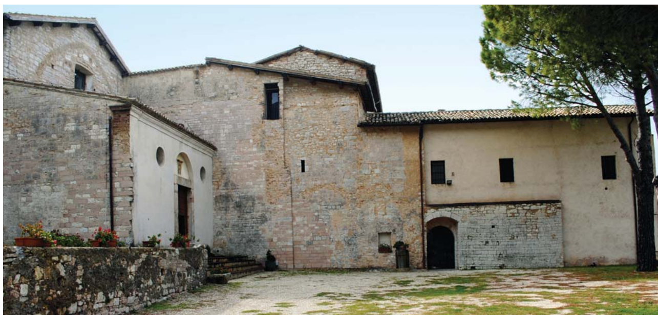
Fig. 1. Abbazia di Sassovivo, veduta della parete sud ovest del sagrato.

dall'archeologia alla storia delle religioni, dall'antropologia alla geologia ecc., si è potuta collegare allo svolgimento di quattro brevi campagne di scavo archeologico susseguites dal 2014 al 2017, condotte – nell'ambito del corso di Metodologia e tecnica della ricerca archeologica tenuto dalle professoressa Lia Barelli e Maria Romana Picuti – dalla Scuola di Specializzazione in Beni architettonici e del Paesaggio della