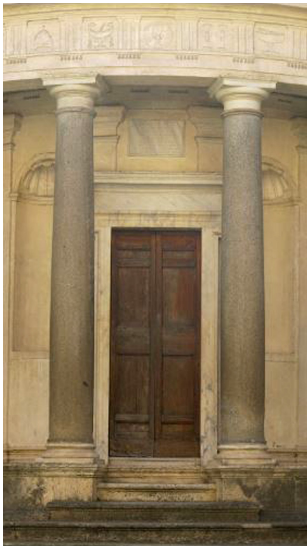
Fig. 2. Roma, Tempietto di San Pietro in Montorio, l'ingresso.

Nelle trabeazioni del Tempietto, Bramante si ispira a diversi modelli antichi e li ricompono in nuove declinazioni, passando dalla scansione più semplice e chiaroscurata del peribolo di colonne e delle paraste del muro della cella, a quella più elegante dell'interno. Qui le paraste sono innalzate su basamento e, quindi, su di un secondo livello rispetto alle ordinanze dell'esterno, a loro volta rialzate