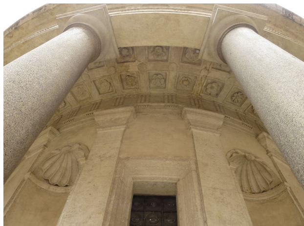
Fig. 3. Roma, Tempietto di San Pietro in Montorio, dettaglio dell'ordine dorico.

Nelle trabeazioni del Tempietto, Bramante si ispira a diversi modelli antichi e li ricompono in nuove declinazioni, passando dalla scansione più semplice e chiaroscurata del peribolo di colonne e delle paraste del muro della cella, a quella più elegante dell'interno. Qui le paraste sono innalzate su basamento e, quindi, su di un secondo livello rispetto alle ordinanze dell'esterno, a loro volta rialzate