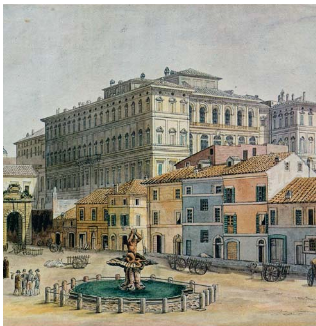
Fig. 3. Troels Lund, Piazza Barberini, 1830 , acquarello su carta 445 × 346 mm, particolare. Copenhagen, Thorvaldsens Museum, inv. D 1826, (da Bellucci, Novella. Trenti, Luigi (a cura di). Leopardi a Roma. Milano: Electa 1998 , p. 227, cat. n. 91); la piazza appare documentata con particolare attenzione; sul fondo, in secondo piano, emerge su tutto la grande mole di palazzo Barberini. Di sicuro interesse conoscitivo è la quinta edilizia che definisce il lato meridionale della piazza che ci trasmette dati volumetrici, proporzionali, tipologici, formali, nonché materici e funzionali.

teri dei luoghi” così come vengono individuati nel pensiero dei primi decenni dell'Ottocento, dove i valori di architettura e di ambiente si interconnettono reciprocamente.