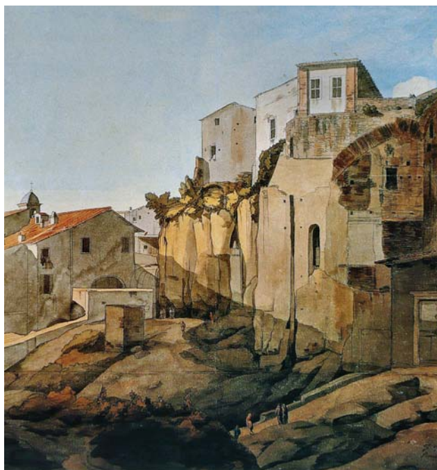
Fig. 2. F. Towne, Via di rupe Tarpea, Roma 1781 , penna e acquarello, 406 × 463 mm, particolare. British Museum, Londra, (da Mammucari, R. Roma città dell'anima. Viaggiatori, Accademie, Letterati, Artisti. Città di Castello: Edimond 2008 , p. 466); efficace la rappresentazione che sottolinea il legame fra elementi naturali e modeste presenze antropiche.