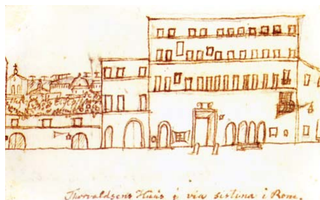
Fig. 1. H.C. Andersen, Casa di Thorvaldsen in via Sistina, Roma 1833 , penna e seppia, (da Mammucari, R. Roma città dell’anima. Viaggiatori, Accademie, Letterati, Artisti. Città di Castello: Edimond 2008 , p. 102); il disegno, ricco di notazioni, documenta le singolarità delle fabbriche rappresentate.

Diversamente, nel tentativo di riassumere le molteplici valenze e le diversificate modalità operative determinate dall’insieme delle “stratificazioni” non si può prescindere da una loro considerazione unitaria; ciò che significa occuparsi dei “carat-