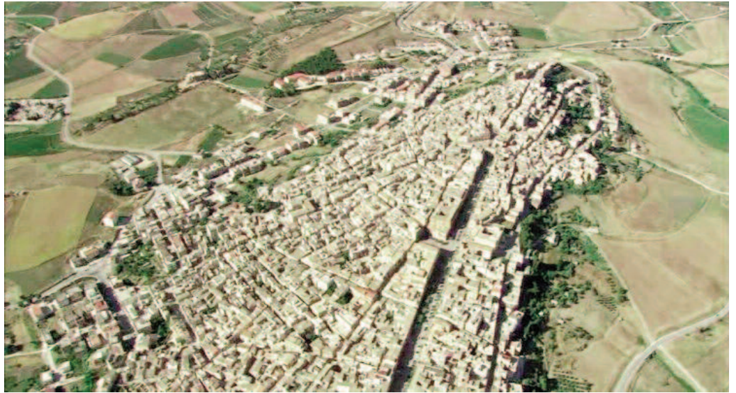
Fig. 3 - Sambuca di Sicilia (AG): Comune di 5.968 abitanti, proclamato "Borgo dei Borghi" nel 2006.

Come continuare - Prospettive di sviluppo del lavoro: un risultato raggiunto non soddisfa mai; lascia sempre intravederne un successivo più sod-