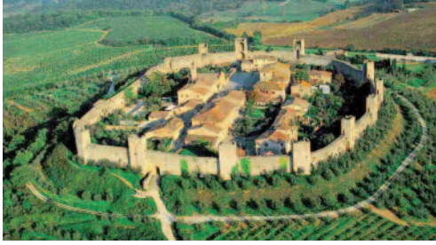
Fig. 7 - Il borgo murato di Monteriggioni in Toscana.

the instruments produced, the initiatives to be undertaken and access to European funding.