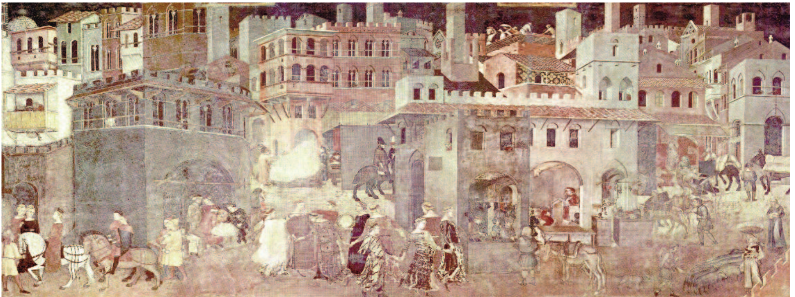
Fig. 1 - Ambrogio Lorenzetti: Effetti di Buon Governo in città, 1338-1340, Siena.

I dati confermano: in Italia a fronte delle migliaia di migranti concentrati in strutture disumane, esiste un patrimonio (per due terzi privato) inutilizzato di circa otto milioni di unità di cui 450.000 abbandonate 1 . Andrebbe quindi favorita la riqualificazione dei paesaggi urbani e periurbani anche con il contributo dei migranti che producono l'8,7% del PIL e costituiscono l'8% della popolazione 2 . Da qui, come garantire la continuità alle città intervenendo all'esterno di esse, sul territorio in modo che venga garantita la necessaria continuità nel progettare, e aggiungendo le opportunità e distribuendo equamente le criticità, si possa fornire la risposta più adeguata al problema di abitare insieme. Ancora