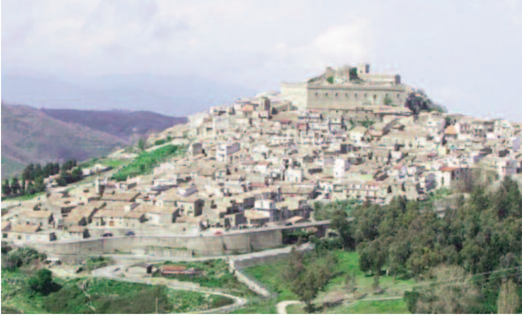
Fig. 4 - Montalbano Elicona (ME): Comune di 2485 abitanti, dichiarato "Borgo più bello d'Italia nel 2015" (Ph. Google Earth, 2016).

gianato, valorizzazione del paesaggio, reshoring ; - urbanistici : si evitano i "non luoghi", con il rilancio del territorio attraverso i distretti, soprattutto quelli industriali. - turismo (11% del PIL): strategia a lungo termine per gestire l'evoluzione del mercato turistico globale, rilancio urbanistico dell'Italia minore, ovvero dei borghi che ne sono protagonisti; si prevede una forte crescita dovuta a Cina e India; in vent'anni - stima l'Onu - i flussi saranno raddoppiati. - agricoltura : l'ultimo Rapporto Svimez conferma l'incremento del suo valore aggiunto per la crescita del PIL nel Mezzogiorno.