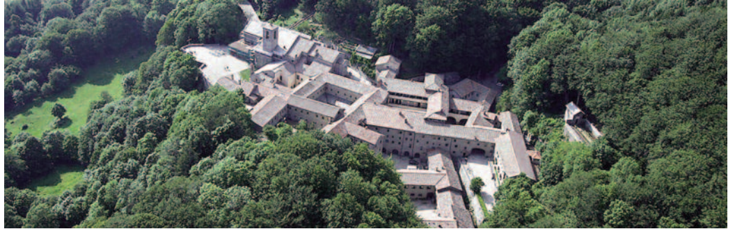
Fig. 6 - Il Borgo di Chiusi della Verna in Toscana.

Research - According to the EU guidelines research analysis has allowed to compare different methods of approach and work, methods characterized by a particular originality, moreover the results are immediately transferrable to the Public Administration (P.A.) and private enterprise for initiatives of "territorial requalification" availing themselves of documents also including EU funding requests. The research aims at "assessing on the field" in contexts entirely different from each other (North and/or South of the country) the methodologies to identify shares of urban fabric urban cell - where the service network (power, transportation, water, waste, etc.) are system based using the extra-large band4; a series of net-