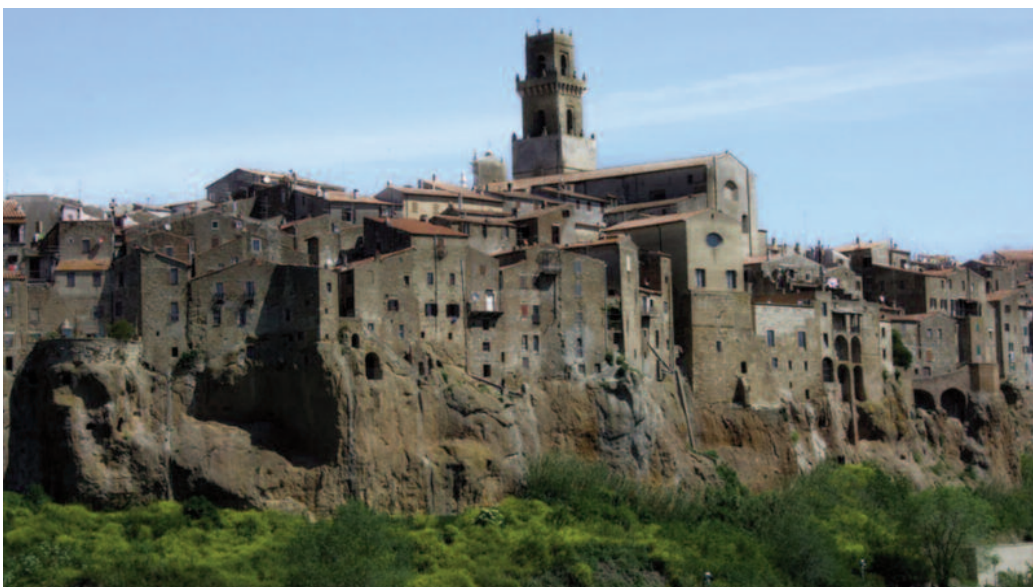
Fig. 5 - Il borgo medievale del Martellino di Pitigliano in Toscana.

Lastly, the cost-benefit analysis through Life Cycle Thinking (LCT) including, besides the economic aspects (possible public, private or mixed funding), also employment and environmental impacts. The findings, appreciated by the competent authorities, have led to workshops to illustrate