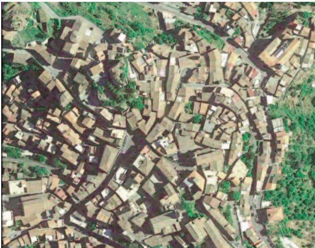
Fig. 2 - Castiglione di Sicilia (CT): il territorio del Comune - 3.259 abitanti - è stato dichiarato con d.r. 21 giugno 1994 di notevole importanza pubblica e nel 2017 è al 5° posto nella classifica dei borghi più belli di Italia.

Un percorso per passare per gradi dalla urban cell alla smart city e da questa alla smart land : l'obiettivo finale delle ricerche; un processo di rilancio socioeconomico del territorio completando l'iter in essere: territorializzazione, deterritorializzazione, ri-territorializzazione, soprattutto in funzione di un contenimento del fenomeno dell'inurbamento nei confronti di centri storici. Un approccio quindi marcatamente interdisciplinare che ha consentito di guardare oltre gli obiettivi al fine di pervenire alla concreta definizione del binomio smart city & smart land . Prendendo ad es. (in questa sede) le tematiche ambientali, si è elaborata una metodologia e una procedura standard che metta a disposizione delle P.A. i necessari apparati tecnico/scientifici per valutare “in chiave energetica” il saldo fra fonti potenziali di energia rinnovabile presenti in un ambito territoriale e consumi energetici che nella stessa area si registrano a fronte delle varie tipologie insediative. Uno degli obiettivi: tradurre la procedura in linee guida in modo che l'Ente Locale possa operare concretamente; esse documentano lo stato di fatto, le iniziative da intraprendere, ne testimoniano i vantaggi; uno studio di fattibilità che consente anche di accedere a finanziamenti nazionali e/o UE integrando le scarse risorse disponibili. Questo l'obiettivo che caratterizza una ricerca perché